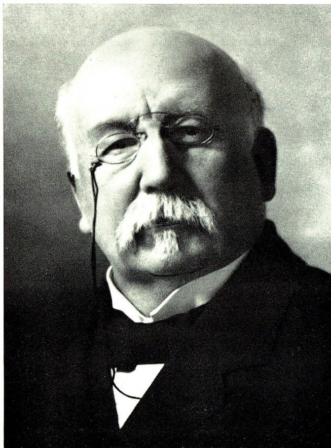
Theodor Curti, 1848–1914

St. Gallischer Regierungsrat (Vorsteher des kantonalen Volkswirtschaftsdepartementes) und Nationalrat, Mitbegründer der im Jahre 1898 ins Leben gerufenen «Höheren Schule (Akademie) für Handel, Verkehr und Verwaltung», die wenige Jahre später in die Verkehrsschule und die Handels-Akademie, die heutige Handels-Hochschule, aufgeteilt wurde.