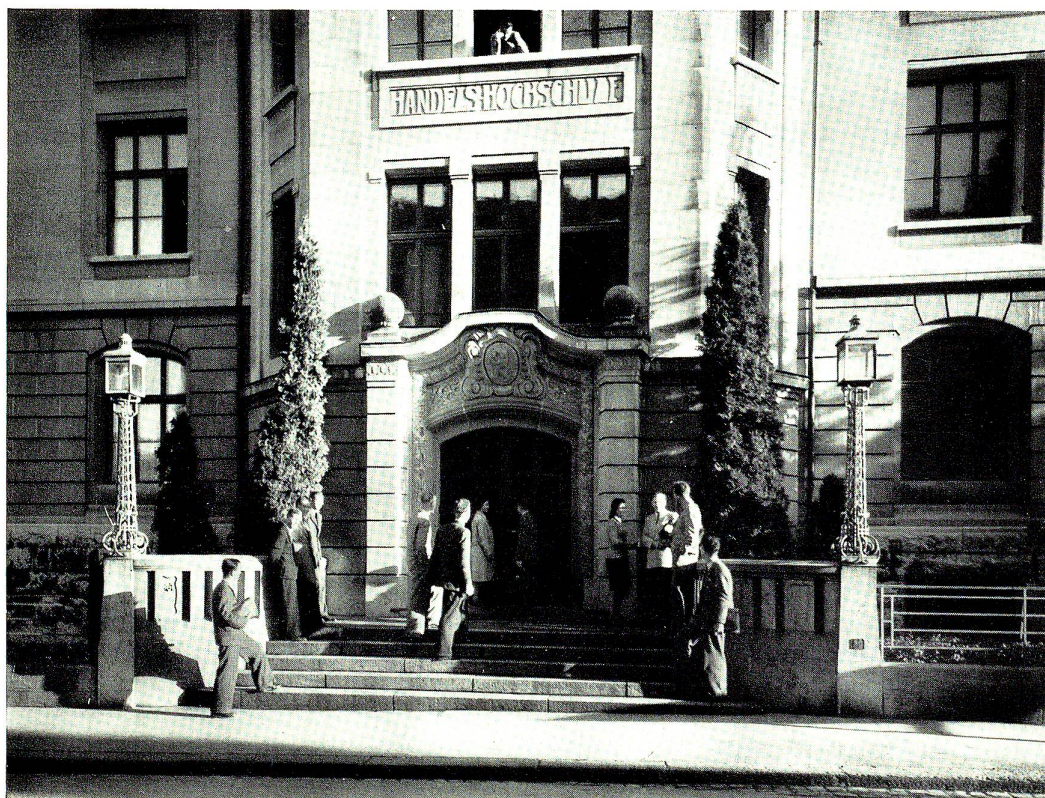
Eingang des heutigen, im Jahre 1911 errichteten Gebäudes der Handels-Hochschule St. Gallen an der Notkerstraße.

dern auch eine Stärkung der innern Front. «Bevorstehenden Auseinandersetzungen über die Neuordnung des innerschweizerischen Wirtschaftslebens können durch die Förderung der Erkenntnisse über allgemeine wirtschaftliche Zusammenhänge eher dem Kampffelde politischer Leidenschaft entzogen und auf den Boden sachlicher Erörterungen gestellt werden 8 .» Seit 1941 bestand bereits das Seminar für Fremdenverkehr und Verkehrspolitik; es folgten das Schweizerische Institut für gewerbliche Wirtschaft (1946), das Versicherungswirtschaftliche Seminar (1949), das Seminar für Agrarrecht und Agrarpolitik (1951), die Forschungsgemeinschaft für Nationalökonomie (1952/53) und das Institut für Betriebswirtschaft (1954). Bei allen diesen Instituten und Forschungsstätten spendete die Wirtschaft, welche der Handels-Hochschule bereits tüchtigen Nachwuchs verdankte und sie auch von Exkursionen her schätzte, bedeutende Mittel, in denen das wachsende Ansehen, das die Hochschule in den Kreisen der Praxis genoß, zum Ausdruck kam. Auch die Freundschaft zu den akademischen Schwestern festigte sich zusehends. Prof. Dr. Theo Keller, der die goldene Rektoratskette von 1944 bis 1951 trug, konnte bei der Fünfzigjahrfeier die Vertreter sämtlicher schweizerischer und etlicher ausländischer Hochschulen begrüßen. Diese eindrucksvolle Feier 9 mußte ins Stadttheater verlegt werden, denn die Aula hätte kaum die nun stets wachsende Zahl der immatrikulierten Studierenden, geschweige denn die Gäste aufnehmen können.