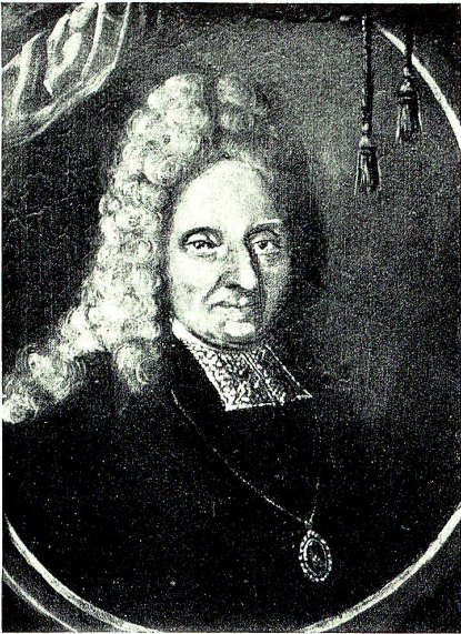
Fidel von Thurn, Freiherr

Gegenstand einer besondern, kaiserlichen Urkunde und einer besondern, feierlichen Übertragung (Bd. 838, f. 78f). Die durch die tridentinische Kirchenreform gestärkte, fürstbischöfliche Regierung erachtete es als ihre hohe Gewissenspflicht, für eine gerechte Handhabung des Malefiz- oder Blutgerichtes zu sorgen. Damit kein unschuldiges Blut fließe, sollten die aus dem hohen und niedern Gericht gewählten Blutrichter bei der Rechtsprechung stets die gedruckte Halsgerichtsordnung Kaiser Karls V. zur Verfügung haben und die Parteien hierüber informieren. In Zweifelsfällen sollen sie sich beim Landesherrn oder Sachverständigen erkundigen. (Vergl. F. Willi, Geschichte von Rorschach, 345.) Diese Bestimmungen kehren seit 1613 bis zum Untergang der äbtischen Herrschaft in allen Bestellungen des Obervogtes wieder.