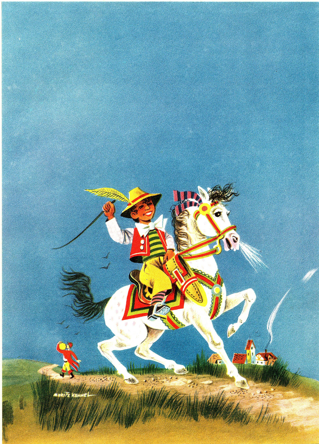
«Hans im Glück»

Titelbild des Märchenbuches aus dem Verlage der Papyria AG. erstellt in Mehrfarben-Offsetdruck von der Graphischen Anstalt E. Löpfe-Benz, Rorschach