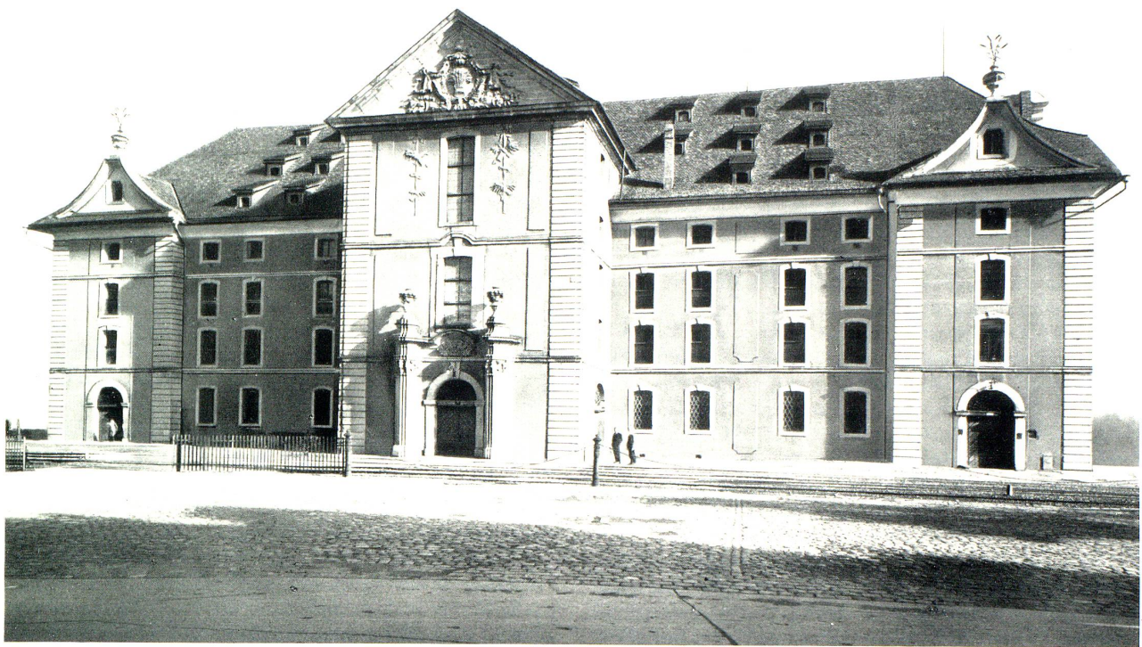
Gesamtansicht des Rorschacher Kornhauses