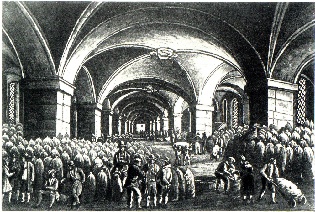
Kornmarkt im Rorschacher Kornhaus

Der Kornmeister beorderte auch die Träger zur Löschung der Frachten. Mit Beginn des Marktes, der durch die Glocke des Kornhauses angekündigt wurde, trug er die Verantwortung, daß die Marktvorschriften eingehalten wurden. Ihm war ebenso die Obhut über die Frucht anvertraut, die im Kornhaus Einlagerung fand. Er hatte darauf zu achten, daß nur gesunde Ware in die Kornschütten hinaufgebracht wurde und kein Ungeziefer sich an die Frucht machen konnte. Wahrscheinlich schon damals teilte sich der Gredmeister mit dem Kornmeister derart in die Verwaltung, daß die Aufsicht über die Spedition der verkauften Frucht aus dem Kornhaus dem Gredmeister zukam.