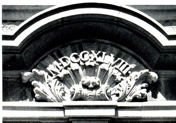
Portalbegrünung des Rorschacher Kornhauses, mit dem Datum 1748

Der Große Rat pflichtete am 19. November 1907 dem Antrage der Regierung einstimmig bei, worauf diese die schon begonnenen Verkaufsverhandlungen mit dem Gemeinderat Rorschach fortsetzte. Am 22. September 1908 gelangte das Kornhaus um die Summe von 100000 Franken in den Besitz der politischen Gemeinde Rorschach. Auch damit kann also im nächsten Jahre das Rorschacher Kornhaus ein kleines Jubiläum begehen.