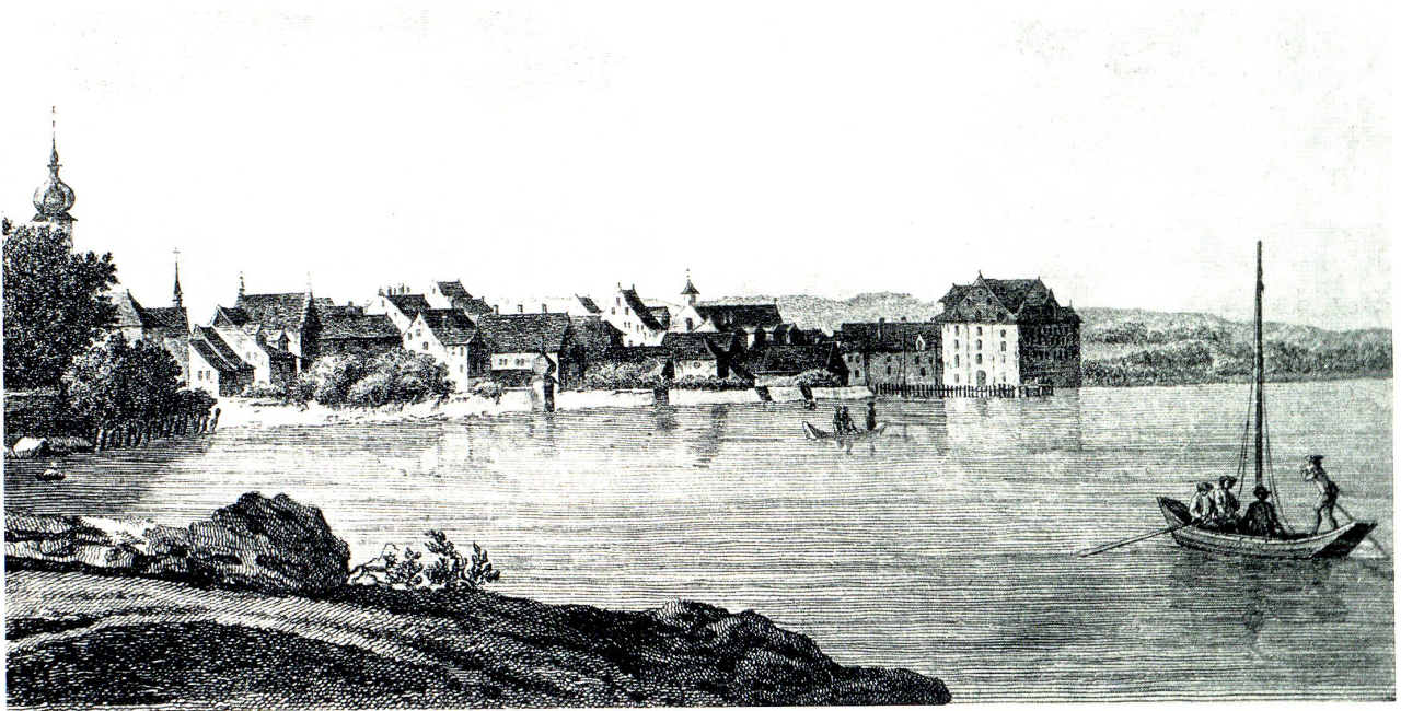
Rorschach von Osten um 1790