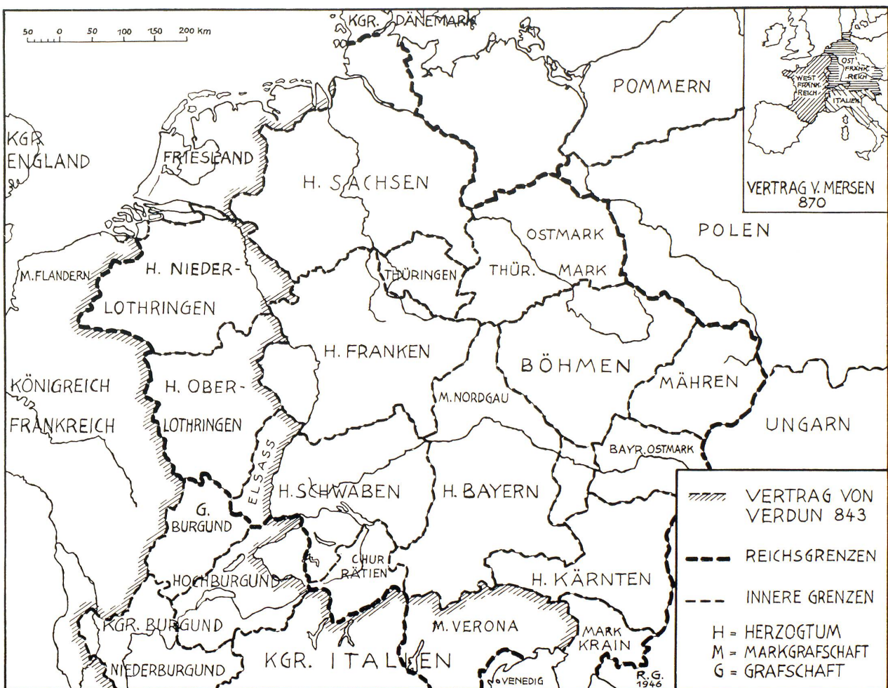
DEUTSCHLAND ZUR ZEIT DER SACHSISCHEN KAISER

Da nun das Reich auf festem Grund stand, begann König Otto in die Geschieke des übrigen Europa einzugreifen. Zweimal warf er die Franzosen über die Grenze zurück und kam bis zur Seine. Von gewaltiger Bedeutung wurde sein Eingreifen in Ober- und Mittelitalien, wo seit dem Tode des letzten Sohnes von Lothar verworrene Zustände herrschten. Wie zur Völkerwanderungszeit war im Gebiet