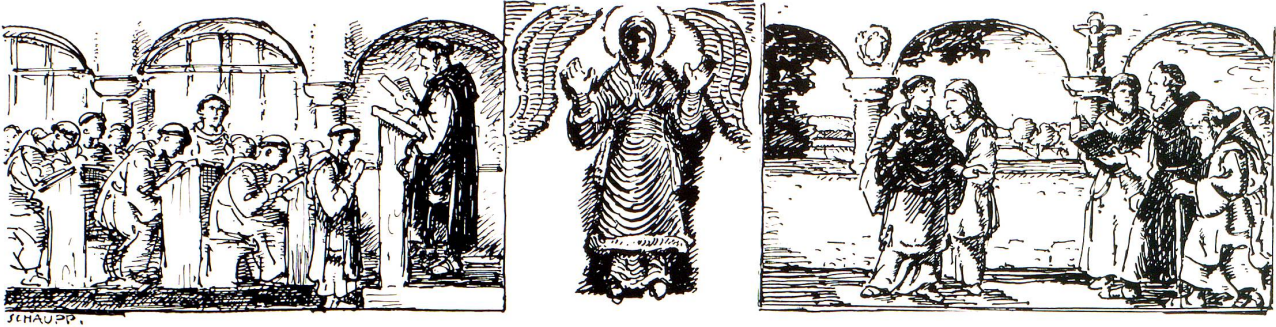
KLOSTER ST. GALLEN

Eingreifen bewenden ließ 35 . So konnten sich die Mohammedaner immer weiter wagen, ins Rheintal, Appenzellerland und bis zum Kloster St. Gallen (954), in dessen Annalen 36 berichtet wird, wie der energische Dekan Walto mit den Knechten des Klosters einer ihrer Scharen den Garaus machte 37-38 . Am schlimmsten litt das unmittelbar in ihrer Ausfallsrichtung liegende Bistum Chur 39 . Noch 961 nahmen die Sarazenen ihren Weg zu den rätischen Pässen 40 dreist durch die Poebene, wobei sie klug genug waren, sich nicht etwa durch Plünderungen in den dortigen Städten Feinde zu schaffen.