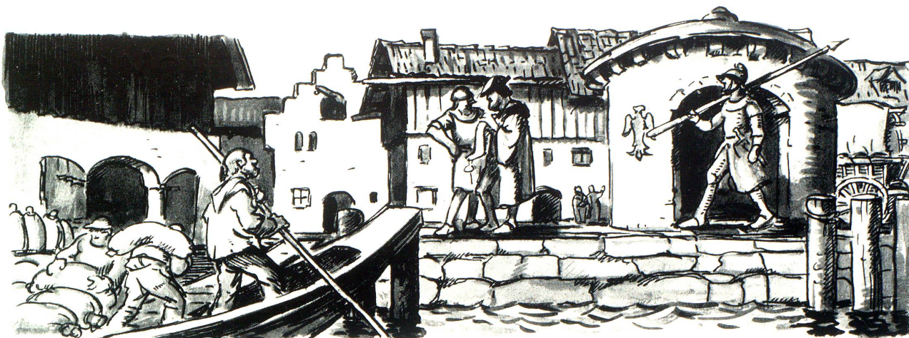
RORSCHACHER LANDUNGSPLATZ UM 900