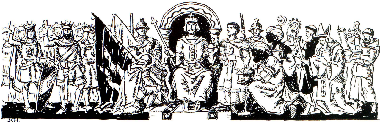
ZEITALTER OTTOS DES GROSSEN

heitsstaate die Rede. Die einzelnen Stämme waren nur äußerlich und lose vereinigt 3 . Durch Erbteilung und durch das Streben nach Reichsunmittelbarkeit mancher Gaue und besonders einer großen Zahl von Städten, durch die Aussonderung oder Immunität des kirchlichen Besitzes, der schließlich ein Drittel von deutschem Grund und Boden ausmachte, entstand eine heillose Zersplitterung 4 .