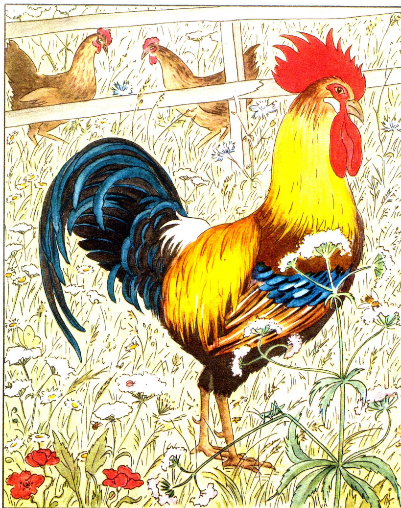
Illustrationsprobe aus H. Thoma: Tierbilderbuch, erschienen im Verlag Rascher, Zürich. Sechsfarben-Offsetdruck, E. Löpfe-Benz, Rorschach.