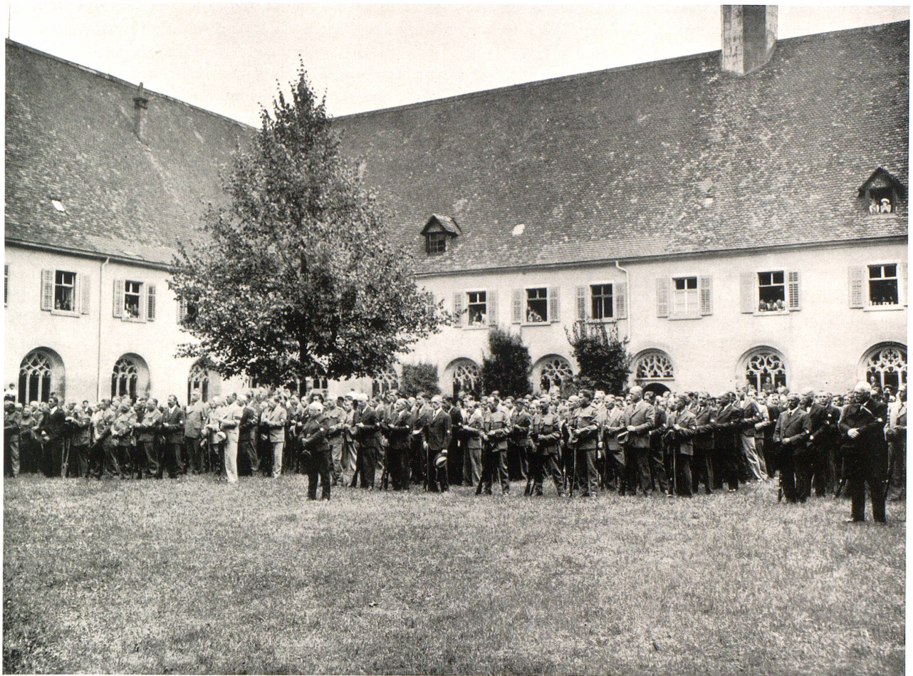
Vereidigung der Ortswehren im Seminarhof Mariaberg