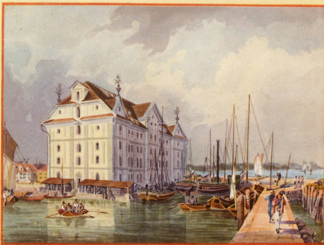
Im Rorschacher Hafen vor hundert Jahren.