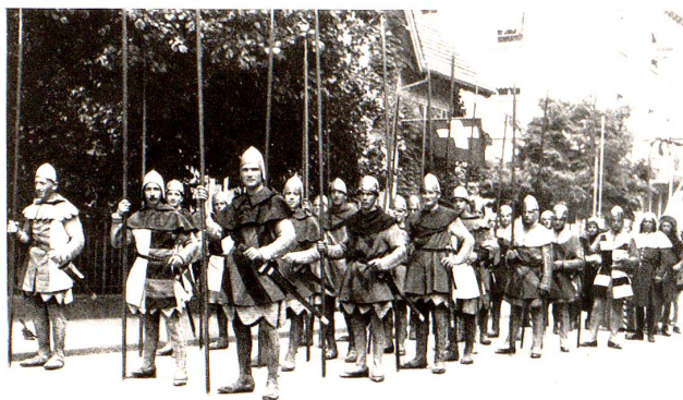
Kriegsvolk der Ritterzeit.

Heiter, vornehm, elegant und genußfroh ziehen Jugend und Alter des graziösen, aber etwas süßlich-femininen Rokoko an uns vorbei. Ein stets anziehendes Bild, das uns lächeln macht, durch seine liebenswürdigen Umgangsformen aber eben viel zur Verfeinerung der Sitten beitragen konnte. O Anmut des Rokoko, wie schienst du die Menschen zart und feinfühlig zu machen ... aber offenbar war das meiste nur äußerlicher Ueber-