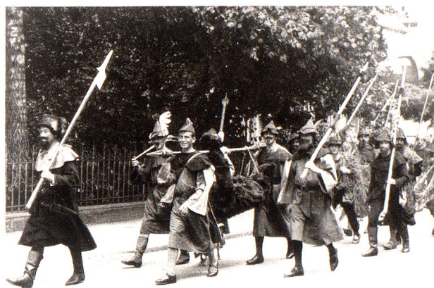
Jagdgruppe der Ritterzeit.

betont: die Versuchung und Gefahr, in billige, triviale und kitschige Darstellung zu verfallen; geschichtliche Fälschungen, resp. Anachronismen zu tolerieren; Nebensachen obenhin mit weitmaschigem Gewissen durchgehen zu lassen: diese Versuchung ist wahrlich groß, bei einer Zahl von ca. 1300 Einzelfiguren! Aber dieser Versuchung sind die Verantwortlichen nicht erlegen, das mußte auch einem sehr strengen Kritiker vollauf klar sein.