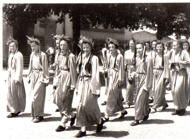
Aehren im Wappen. Mädchengruppe.