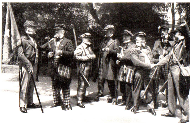
Fähnlein der sieben Aufrechten.