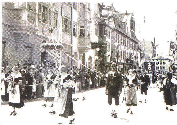
Freiheitsbaum in der Zeitenwende.

Unsere kurze Rückschau hat nicht entfernt alles würdigen können, das erwähnenswert wäre. Vergessen wir