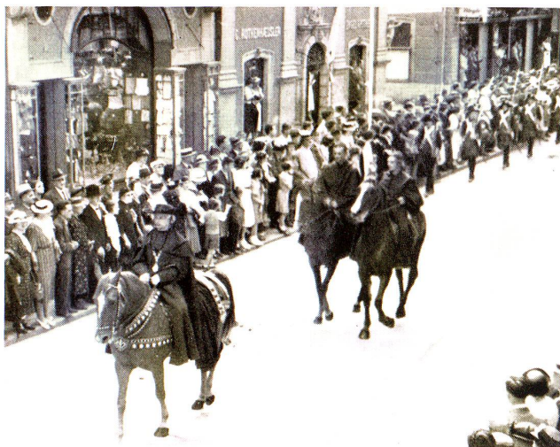
Abt Beda mit Gefolge.

Man wußte schon lange vor dem Feste, daß auch diesmal die Rorschacher etwas Großzügiges im Sinne führten und daß aus allen Volkskreisen die Gerufenen bereitwillig mitzuwirken versprochen. Und so gelang denn das Unternehmen, das für unsere liebe Stadt neuerdings Ehre einlegte und allgemeinste Anerkennung fand.