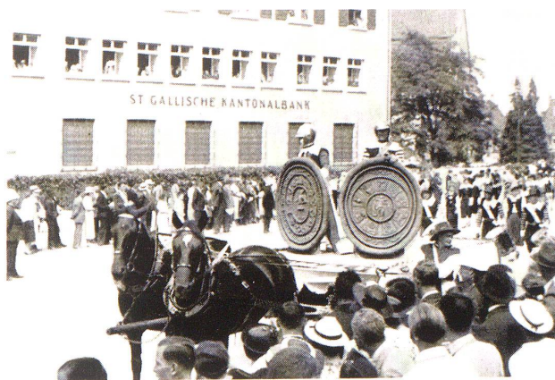
Siegel der Constantia-Zunft und der Zunft Johanne Batiste.

Vor etwa 50 Jahren, wenn wir nicht irren, fand in Hier ein Umzug statt, der ebenfalls historische Momente darstellte; es muß irgendwo noch ein Album mit Photographien davon vorhanden sein. Es müßte überaus lehrreich sein, sich anhand jenes Albums ein Urteil zu bilden über die damalige Art, derartige Dinge zu behandeln. Unsere Erinnerung an die genannte Photosammlung ist höchst ungünstig. Den Zug selbst haben wir damals nicht gesehen. Es sei aber hier nochmals