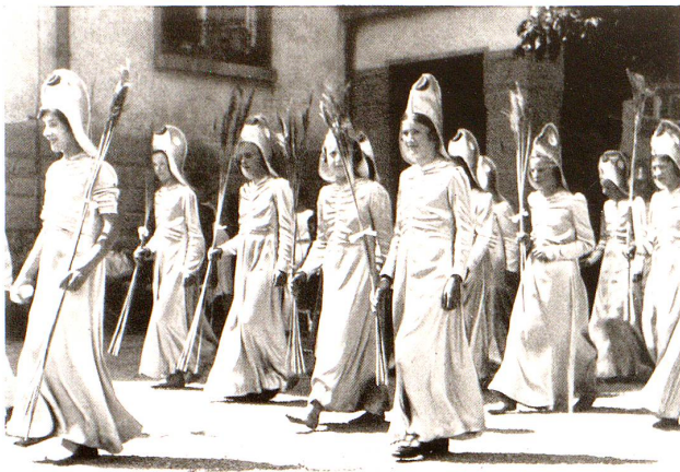
Fische im Wappen. Mädchengruppe.