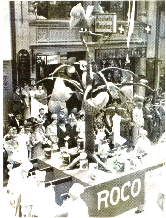
Wagen der Conservenfabrik A.-G., Rorschach.