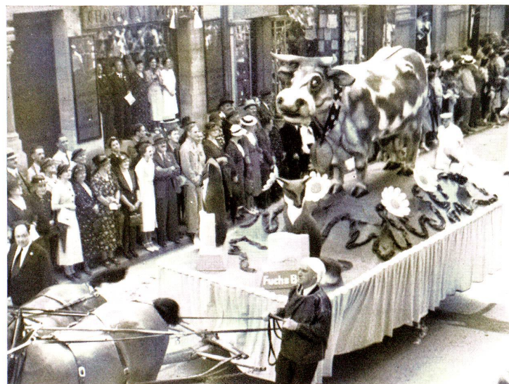
Wagen der Firma Fuchs & Co., Molkereien, Rorschach.

Ehre all denen, die sich um das Gelingen des Festzuges durch Arbeit und Opfer verdient machten, und Dank und hohe Anerkennung allen Mitwirkenden!