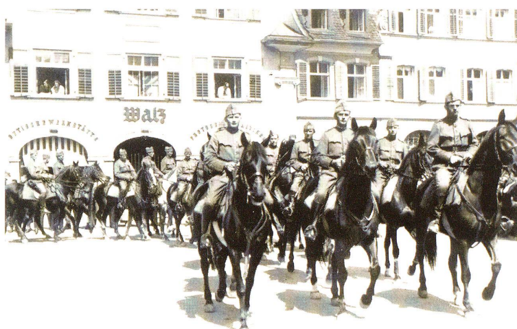
„Fest im Sattel“

zeigten die Kavalleristen unter dem Sattel ihre «feurigen Eidgenossen», durchwegs prächtiges, gepflegtes Pferdmaterial vornehmlich irischer Zucht. Das Auge konnte sich an dem von Herrn Train-Adj.Uof. Buschor