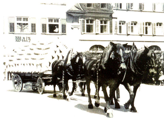
«Des Volkes Nahrung» (Bruggmühle, Goldach)

phon der eifrige «Speaker» (der nota bene als Erprobter seine Sache gut gemacht hat) durch Ansage der ersten Nennung in der leichten Kategorie — offen für Soldaten und Gefreite — die offizielle Springkonkurrenz. Im «Preis vom Marienberg» kämpften 53 Reiter um die Siegespalme. Die Piste führte über 8 Hindernisse, maximum 1 Meter hoch, maximum 2 Meter breit. Es starteten hier hauptsächlich junge Dragoner als beachtenswerter Nachwuchs, deren Pferde sich in guter Kondition befanden. Dem einen oder andern «Eidgenossen» mag vielleicht die begonnene Arbeit in Wiese und Feld etwas in die Knochen geschlagen haben, oder war er von dieser «sonntäglichen Beschäftigung» nicht gerade erbaut? Einige der Konkurrenten gehörten zu den «Verbliebenen», zu jenen, die wohl immer sang- und klanglos abseits von der Strasse des Erfolges stehen werden oder nur auf gut Glück bauen. Sie verkannten dabei gar oft das «Vorwärts» in steter Verteidigung, in der Sorge um das eigene «Ich», im Kampf vor dem «Fall». — Das Pferd ist eben ein Lebewesen, das bei willensschwachen Reitern seinen eigenen Willen machtvoll durchsetzt. — Im Hinblick auf den Saisonbeginn und den Charakter dieser Soldatenserie als Einführungsspringen, waren die Leistungen recht gut. Dem Fachmann mögen da und dort wohl noch Mängel in Haltung, Sitz und Steuerung aufgefallen sein. Es ist in-