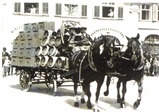
«Für den Durst» (Brauerei Löwengarten A.-G., Rorschach)

tur, und nicht mit einer Schweizer Qualitätsuhr zu vergleichen, die tagtäglich fehlerlos läuft. Qualitativ Hervorragendes ist in Rorschach im schweren Soldatenspringen geboten worden. Die Leistungen standen auf einer erfreulichen Basis. Sie vermochten allseits volle Anerkennung abzuwingen. Egnach stellte hier seine