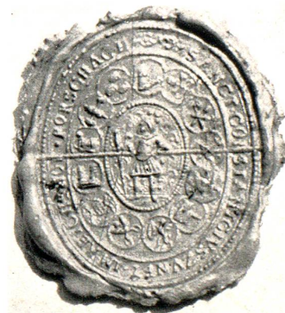
Siegel der St. Constantius-Zunft in Rorschach

Die Geschichte kennt keinen Stand, der innert kurzer Zeit einen so bedeutungsvollen Aufstieg aus der Masse des Volkes nahm wie die aufstrebende Beamtenschaft der Ministerialen. Aus den freien Lehensträgern und Ministerialen weltlicher und geistlicher Fürsten bildete sich durch den gemeinsamen Waffendienst eine neue Aristokratie, der in kurzer Zeit eine ausnahmsweise Bedeutung und Macht beschieden war. Der Adel war unter sich nicht gleichgestellt, der niedere Ritter war Lehens- und Dienstmann grösserer Herren. Nach aussen bildeten hoher und niederer Adel einen bevorzugten Stand, dem auch ein eigenes Recht zukam. Den grossen