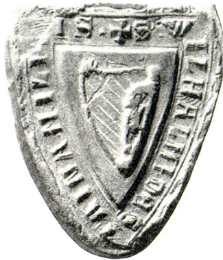
Siegel: Wilhelm von Steinach 1291