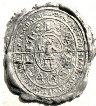
Siegel der St. Constantius-Zunft in Rorschach

Die Geschichte kennt keinen Stand, der innert kurzer Zeit einen so bedeutungsvollen Aufstieg aus der Masse des Volkes nahm wie die aufstrebende Beamtschaft der Ministerialen. Aus den freien Lehensträgern und Ministerialen weltlicher und geistlicher Fürsten bildete sich durch den gemeinsamen Waffendienst eine neue Aristokratie, der in kurzer Zeit eine ausnahmsweise Bedeutung und Macht beschieden war. Der Adel war unter sich nicht gleichgestellt, der niedere Ritter war Lehens- und Dienstmann grösserer Herren. Nach aussen bildeten hoher und niederer Adel einen bevorzugten Stand, dem auch ein eigenes Recht zukam. Den grossen