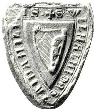
Siegel: Wilhelm von Steinach 1291