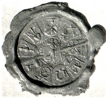
Siegel der St. Johann-Zunft

Abtes gefolgt, dazu viel fahrend Volk. Der Abt sorgte für Brot und Wein, weshalb er seine Fuhrleute gegen Botzen, nach Neckerwin, ins Elsass sandte. 90 Ritter erhielten vom Abte den Ritterschlag. Der Bischof von Basel sperrte die Weindurchfuhr und erzürnte dadurch den Abt. Diese Gelegenheit benützte Graf Rudolf, um eine Fehde mit dem Bischofe auszutragen, und warb beim Abte um Zuzug. «Do warb der abt an alle die herren die zu der hochzit warent, das sie im dienotin» und stiess mit mehr als 300 Rittern, «die alle gezelt wurdent, zuo Seckingen über die brugg».