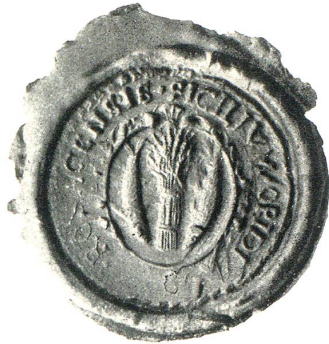
Sigillum opidi Rosacensis 1689

angesehene Standesgenossen. Das Wappen vererbte sich allmählich. Nach dem Wappenrechte des 13. und 14. Jahrhunderts konnte es aber auch ganz oder teilweise verschenkt, verkauft oder zu Lehen gegeben werden. Im 15. Jahrhundert schwoll besonders unter Friedrich III. die Zahl der Wappenbriefe, welche die Führung schon gebrauchter oder neuer Wappen bestätigten, gewaltig an; denn der ewig in Geldverlegenheit stekende Hof fand darin eine bequeme Hilfsquelle.