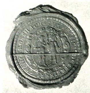
Siegel der vereinigten Zünfte des Reichshofs Rorschach