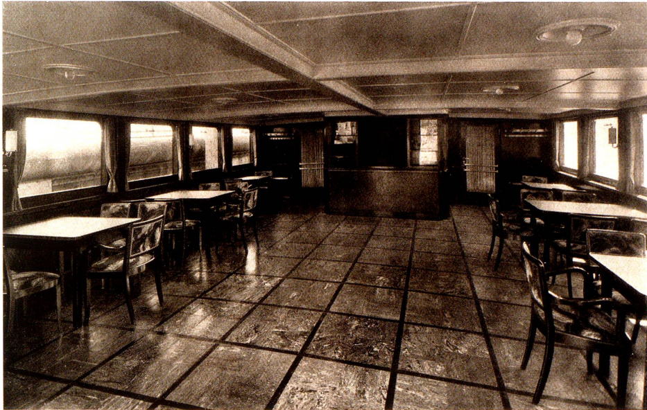
Salon des neuen schweiz. Doppelschrauben-Dieselmotor-Passagierschiff «Thurgau»