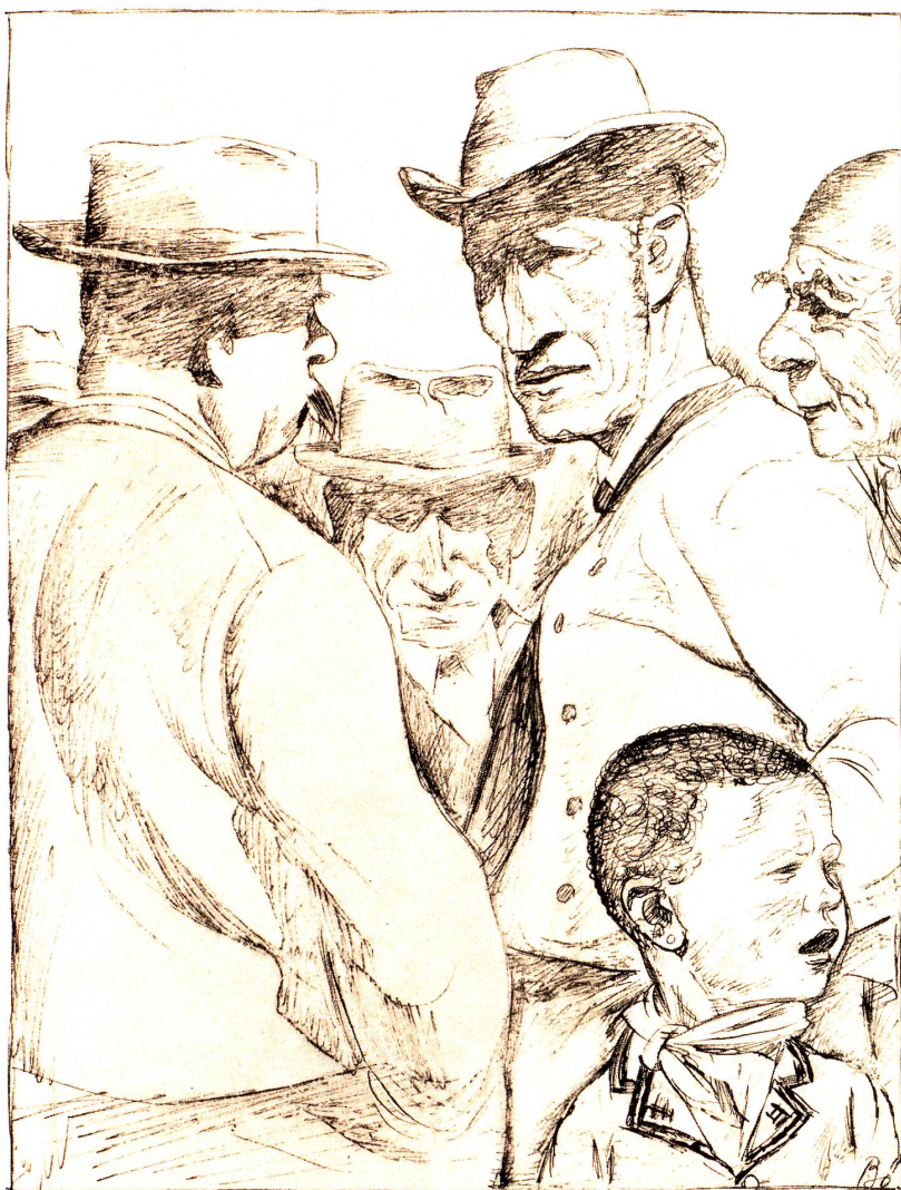
Auf dem Markt in Appenzell.