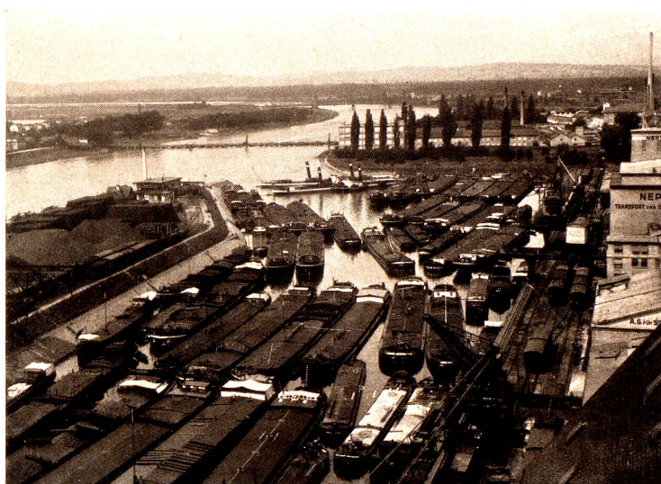
Basel: Rheinhafen Kleinhüningen. 1931.

Ausbau des Rheinstromes selbst zwischen Strassburg und Basel, so bekommt man ein ungefähres Bild davon, wie sehr alle Uferstaaten zu engerer Verbindung mit dem Flusse, zu besserer Nutzung seiner Verkehrsvorteile drängen und wie sehr die wirtschaftliche Macht des rheinischen Verkehrssystem von Jahr zu Jahr wächst. Nicht nur zu oberst treibt der Baum kräftige Sprossen, sondern auch die Seitenäste greifen immer weiter in den mitteleuropäischen Wirtschaftsraum aus, den ganzen in seiner Naturkraft und Naturwirkung unvergleichlichen Organismus weiter stärkend. Sorgen wir dafür, dass auch wir uns diesem lebensvollen Organismus anschliessen, dass wir durch ihn zu Licht und Luft getragen werden; hüten wir uns abseits zu stehen; denn in seinem gewaltigen Schatten würden wir zum mindesten keine Erleichterung unseres wirtschaftlichen Daseins zu erwarten haben.