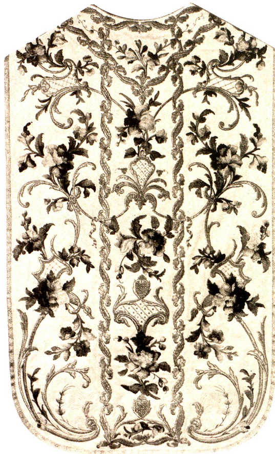
Bild 2. Blumen-Casel.

vergleiche allenthalben die Goldstickerei in den Ranken und stilisierten Blättern, endlich die Blumenbuketts mit ihrem wunderbaren Farbenrealismus, in denen die Lieblingsteine des 17. Jahrhunderts in Blau und Rot dominieren.