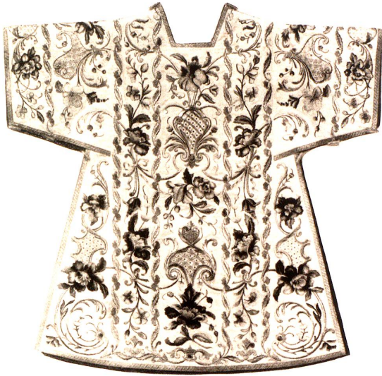
Bild 4. Dalmatika.