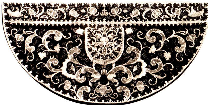
Bild 6. Pluviale.

Der Freund eines wertvollen Silberschatzes wendet sich unter den Kirchen an den Ufern des Bodensees mit Vorliebe nach St. Kolumban in Rorschach. Die textilen Kleinodien daselbst werden sein Interesse in gleichem Masse befriedigen.