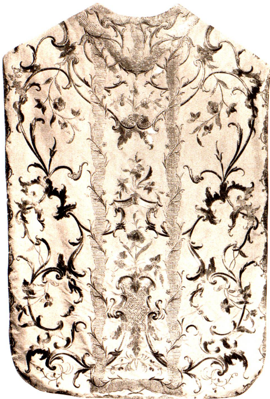
Bild 1. Rokoko-Casel.