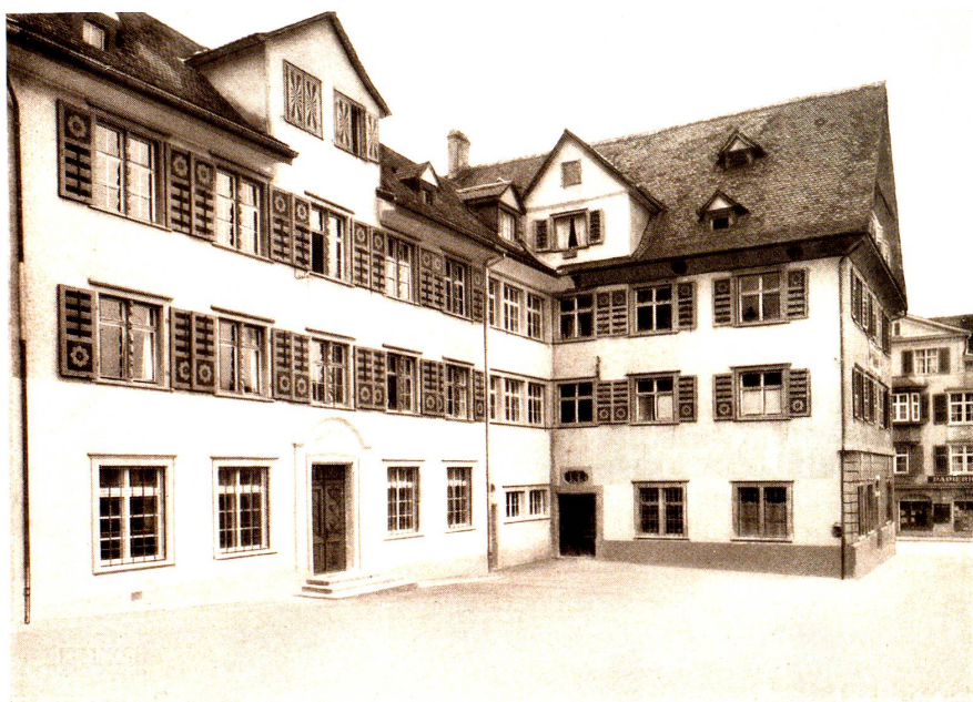
Rathaus Rorschach (Ostfront).

COGIMUR ANTIQUOS PATRUM RENOVARE DOLORES.