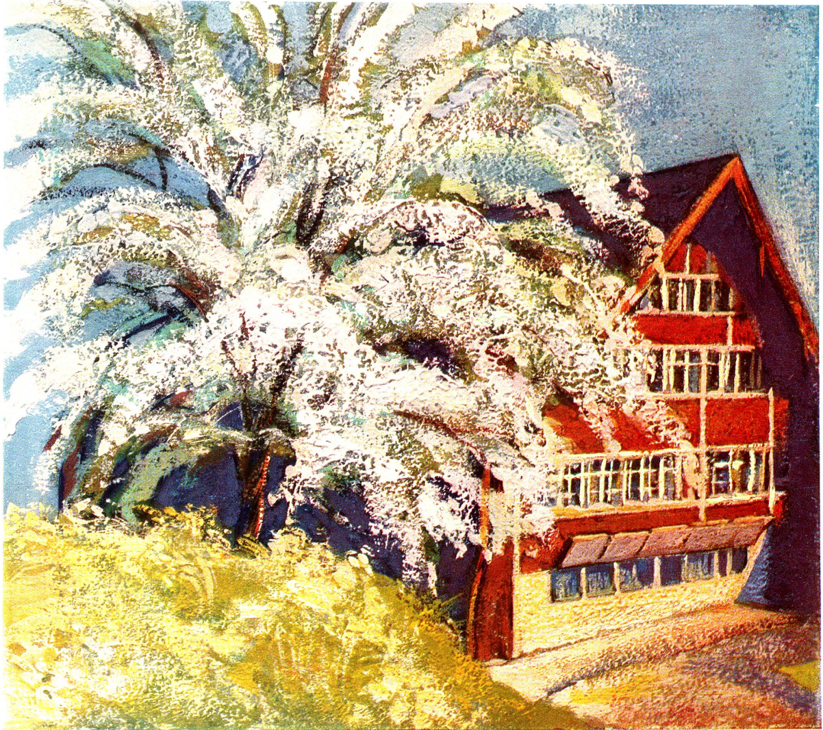
Weberhäuschen im Appenzeller Vorderland Nach einem Gemälde von C. Böckli in Rorschach

Wandkalender der Seidengaze A. G. in Thal Vierfarbendruck aus der Praxis der Buchdruckerei E. Löpfe-Benz in Rorschach