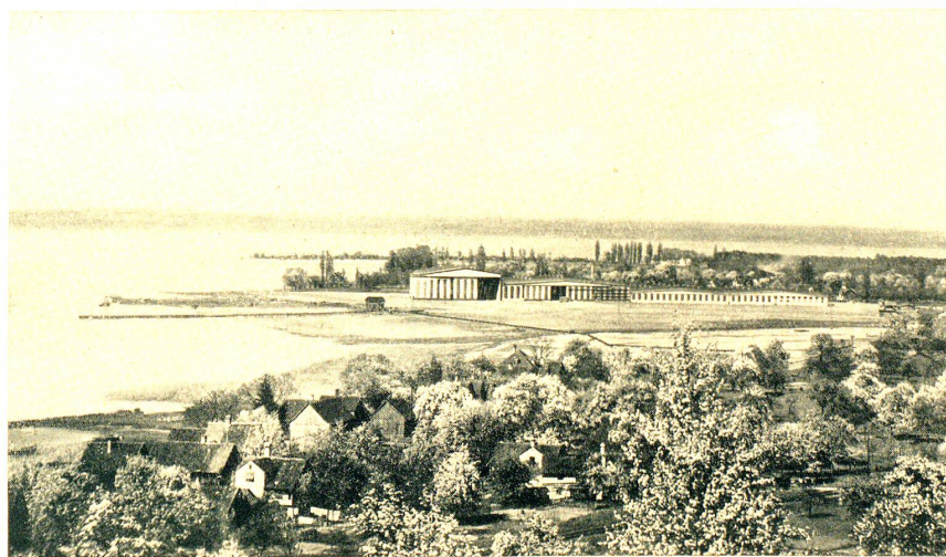
Flugzeugwerft „Dornier“ Altenrhein bei Rorschach

Okt. 31. Ein prächtiger Herbst war uns beschieden. Der August erfreute mit herrlichen Tagen, nur die dritte Woche fiel regnerisch aus. Beinahe ohne jede Trübung schritt der September über Land, in Flur und Reben der reiche Segenspender. Ebenso herrlich und für Tausende von Wenigerbemittelten trostreich verlief der Oktober mit mildsonnigen Tagen am Anfang, etwas kühler gegen die Mitte hin. Die Höhen wurden wohl schneelig, aber nur für kurze Zeit. Gegen den Schluss krochen die Herbstnebel über unsere Höhen, und kühle Regenschauer machten eine warme Stube lieb.