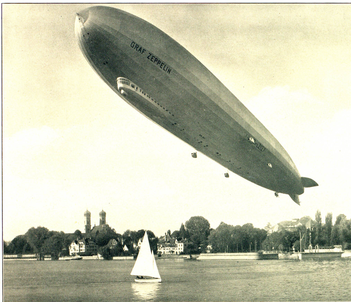
«GRAF ZEPPELIN» ÜBER FRIEDRICHSHAFEN