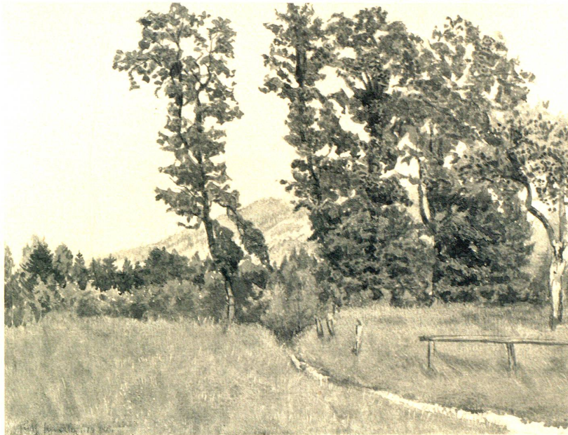
Eich-Untereggen. Nach einem Aquarell von Fritz Kunkler, Rorschach.

Er blieb stehen, um dies Tun zu verfolgen. Die schwarze Traumgestalt war so schlank, schien so zit- ternd, als sie nun die Handschuhe abstreifte, um mit