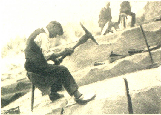
Mittels „Weggen“ und „Bissen“ gelöste Platten.

erstenmal detaillierte Seetiefenmessungen bei Staad vorgenommen wurden, die aufs neue die sehr ungünstigen Verhältnisse bei Niederwasser offenbarten. Es wurden umfassende Massnahmen, vor allem Damm- und Baggerung empfohlen.