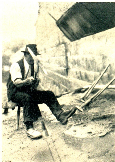
Die Arbeit mit dem „Zweispitz“.

Jetzt legte sich der Bodensee-Segelschiffer-Verband ins Mittel. 1888 umfasste dieser Verband, dessen Rechtsdomizil Arbon war, 24 Mitglieder mit 21 Segelschiffen. Die Versicherungssumme betrug 50,000 Franken, die gesamte Tragkraft der Schiffe 1075 t. Der Verband nahm in seinen Hauptversammlungen jedesmal Stellung zu der Staader Hafenfrage, erinnerte auch an zwei wegen der schlechten Anlande-verhältnisse 1885/86 versunkene Schiffe und stupfte wiederholt die Thaler Gemeindebehörde. Der Verband brachte es dazu, dass im Winter 1888/89 zum