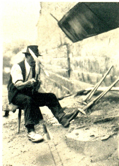
Die Arbeit mit dem „Zweispitz“.

Jetzt legte sich der Bodensee-Segelschiffer-Verband ins Mittel. 1888 umfasste dieser Verband, dessen Rechtsdomizil Arbon war, 24 Mitglieder mit 21 Segelschiffen. Die Versicherungssumme betrug 50,000 Franken, die gesamte Tragkraft der Schiffe 1075 t. Der Verband nahm in seinen Hauptversammlungen jedesmal Stellung zu der Staader Hafenfrage, erinnerte auch an zwei wegen der schlechten Anlande-verhältnisse 1885/86 versunkene Schiffe und stufte wiederholt die Thaler Gemeindebehörde. Der Verband brachte es dazu, dass im Winter 1888/89 zum