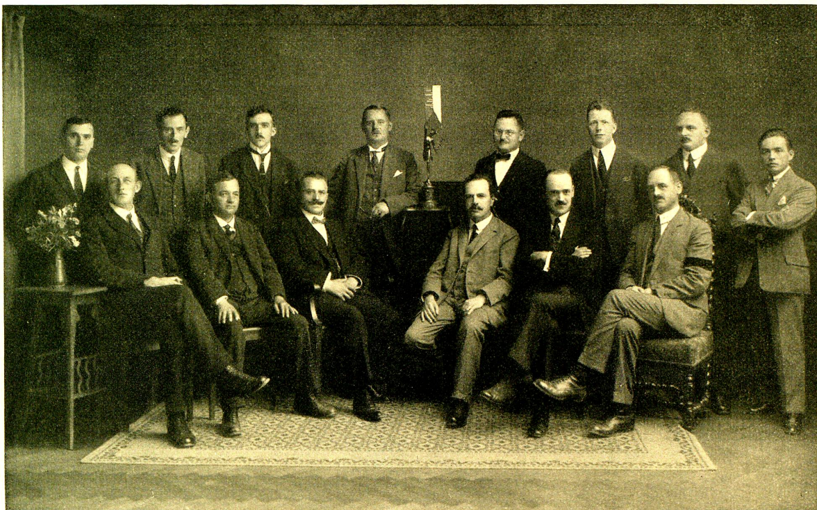
Der Vorstand des Kaufmännischen Vereins und der Handelsschule Rorschach