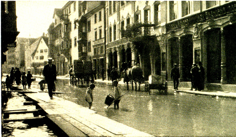
Ueberschwemmung der obren Hauptstrasse, mit beidseitigen Notstegen.

tone dem Seehochwasser machtlos gegenüberstehen. Für die tiefer gelegenen Gebiete unserer Gemeinde tritt noch hinzu, dass bei starken Regenfällen die bis weit hinein vollgestauten Bäche und Ableitungen ausbrechen und die Strassen so lange überfluten, bis der verlangsamte natürliche Abfluss den unterbrochenen Verkehr wieder frei gibt. Diese Uebelstände machten sich am 22. Juni am gleichen Nachmittag bei heftigen Gewittern zweimal so stark bemerkbar, dass eine Anzahl Verkaufsräume mit schmutzigem Bachwasser überschwemmt wurden. Einzig wirksame Abhilfe kann nur