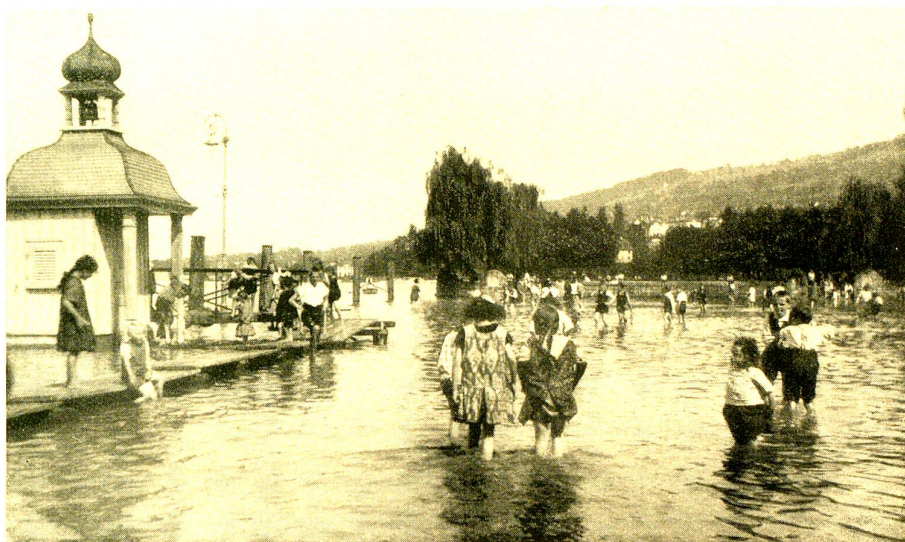
Ueberflutung des Kabisplatzes beim Signalhäuschen.

Jugend eine willkommene Gelegenheit, gehörig im Nassen zu planschen und zu waten. Mit Halloh wurde es begrüsst, als östlich des Zollschuppens das Wasser in die Geleise und damit gegen den Hafenbahnhof seinen Weg nahm. Bald folgten die Ueberflutung des Bahngeleises unterhalb des Kornhauses, der Kornstrasse, ferner der Seestrasse und