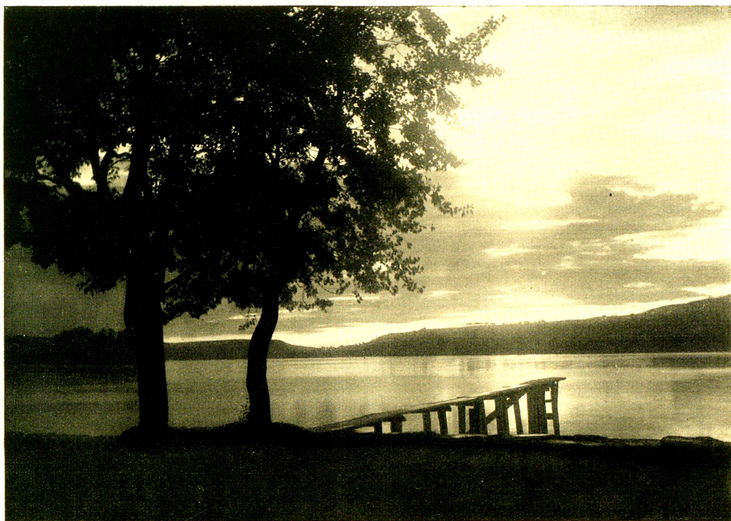
Abendstimmung am Untersee

Da machte ich mich denn einst zu meinen Knabenzeiten mit einem Tragkorb in den Wald oder ins Hochmoor. Wir haben ja hier beides vor der Türe, und holte Moos. Was es doch für Moose gibt! Winzige Palmwälder von unglaublicher Zierlichkeit. Samtweiche, schreiendgrüne Elfantanz-