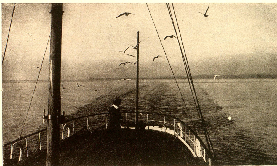
Möwen auf dem Bodensee

der nämliche ans alte Nest zurückkehrt usw., wie alle die zahllosen Fragen lauten. Also war der Vogel zu kennzeichnen. Dies durfte ihn aber weder behindern, noch gar verunstalten. Zuletzt kam man darauf, den Vögeln einen leichten Aluminiumring an einem Beinchen anzulegen, auf dem eine Inschrift und eine bestimmte Nummer steht. Wird dann später ein derart beringter Vogel zufällig aufgefunden (des Ringes wegen soll er nicht etwa getötet werden), so kann man an Hand der Angaben des Ringes, die in eine Kontrolle eingetragen wurden, alles Mögliche feststellen. In einem jeden Lande führt eine bestimmte Stelle Buch über diese Beringungen. In unserem Lande hat die „Schweizer. Gesellschaft für Vogelkunde und Vogelschutz“ diese Tätig-