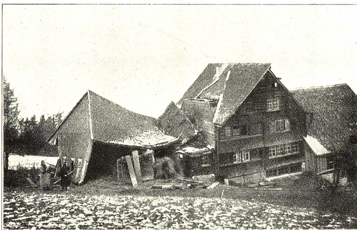
Wirkung des Föhnsturmes am 5. Januar 1919 in Grub-Eggersriet.

Mit vielen Kosten, Zeit und Mühe wurden die Gegenstände, die ohne Butter leben können, entfettet. Wenn man Kleider chemisch behandelt, erhält man einerseits allerdings wieder saubere Kleidungsstücke, andererseits aber leider keine frische Butter mehr und namentlich keine vom Freund Seppatoni.