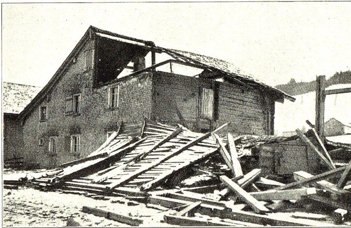
Wirkung des Föhnsturmes am 5. Januar 1919 in Grub-Eggersriet.

angerückt und Frau Sanft verwandelte sie sofort in Fett, Butter und Käse. Mit Vorbedacht bereitete sie dem verwöhnten Gemahl alle Speisen aufs feinste und ging mit dem Fett um, als lebte man nicht mehr in den sieben mageren Jahren der Rationierung. Herr Sanft taute wieder auf, war liebenswürdig, heiter wie in den seligen Zeiten des Butter-vollmonds. Aber am