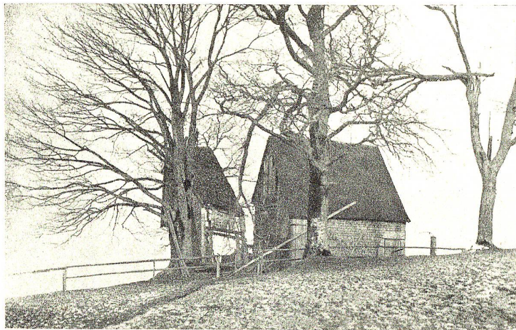
Wirkung des Föhnsturmes am 5. Januar 1919 in Grub-Eggersriet.

Bei einem bescheidenen bürgerlichen Mittagsspeise brach die Erkenntnis durch. Frau Angelina hatte die leere Suppenschüssel bereits abgetragen und stellte nun eine Platte mit Appenzellerwürsten und eine andere mit gerösteten Erdäpfeln auf den Tisch. Die beiden Gerichte müssen oft miteinander zur Parade trotz ihres verschiedenen Wesens. Die Appenzellerwurst, demokratischen Geblütes, einfach, solid, tüchtig, nährt vorzüglich und beansprucht keinen grossen Platz im Magen. Wie mit andern Leuten aus dem Volke macht man mit ihr auch wenig Federlesens. Eine Pfanne voll Wasser, ein heisses Bad — und sie ist zum Opfertode bereit. Sie besitzt zudem die kostbarste, die höchste, die