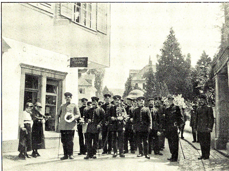
Abreise deutscher Kriegs-Internierter in Rorschach nach ihrer Heimat.

von der Schweiz gesehen haben, wenn sie doch so lange haben hiersein müssen. Interessant und überraschend war, wer sich alles als gehfähig fühlte, als es auf den Hoh. Kasten ging. Ein Unfallversicherungs-inspektor hätte seine Freude daran gehabt! Mit dem Wunsche, der Friede möge bald dieser schönen und guten Sache, d.h. der Kriegsgefan-