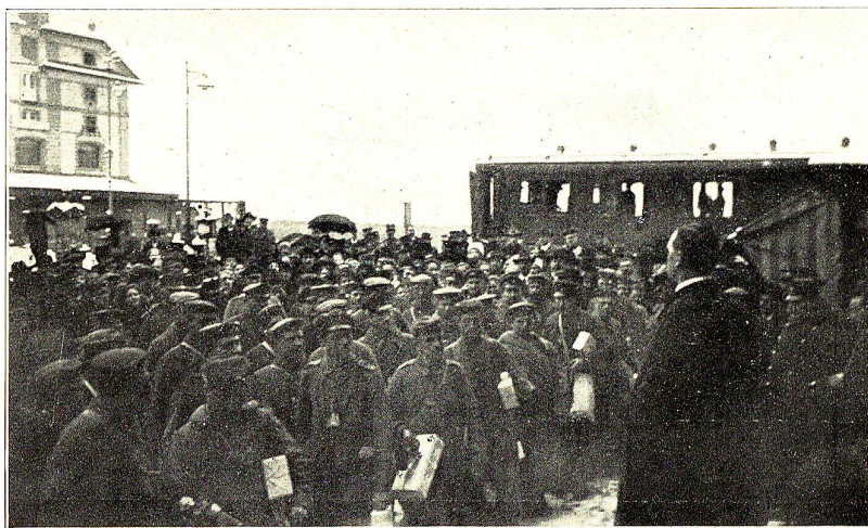
Ankunft deutscher Internierter in Rorschach am 19. Dezember 1916. Begrüssung am Hafenplatz.

Abkommen; mancher wurde aus diesem und jenem Grunde an einen anderen Internierungsort versetzt, so etwa 20 Mann, die wenig Aussicht boten, innerhalb absehbarer Zeit arbeitsfähig zu werden, nach Ermäntungen, wieder andere, die an anderen Internierungsorten bereits arbeitsfähig geworden