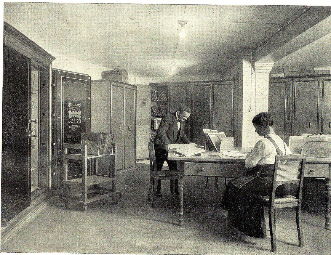
Stahlpanzerkammer für die Wertpapierverwaltung

Zürich • Basel • Frauenfeld • Genf • Glarus • Kreuzlingen • Lugano Luzern • Romanshorn • Weinfelden