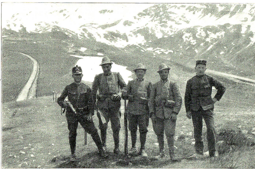
An der italienisch-schweizerischen Grenze.

Damit machte sich der Mann fröstelnd heim. Der Knabe aber sprang von der Brücke in den Bach und suchte und suchte lange. Auf einmal tat er einen Jubelschrei. Er hatte die goldene Nuss gefunden.