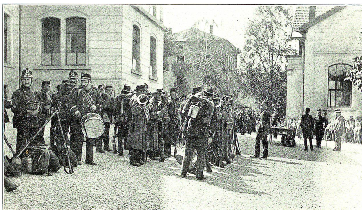
Mobilisation der Landsturmkompanie 73/IV in Rorschach.

wenn der Leser sich vergegenwärtigt, um welche Werte, Güter und Interessen sich das gewaltige Ringen dreht, so kommt einem manches andere lächerlich gering und trivial vor. — Wir haben uns jetzt an den Kriegszustand gewöhnen müssen.