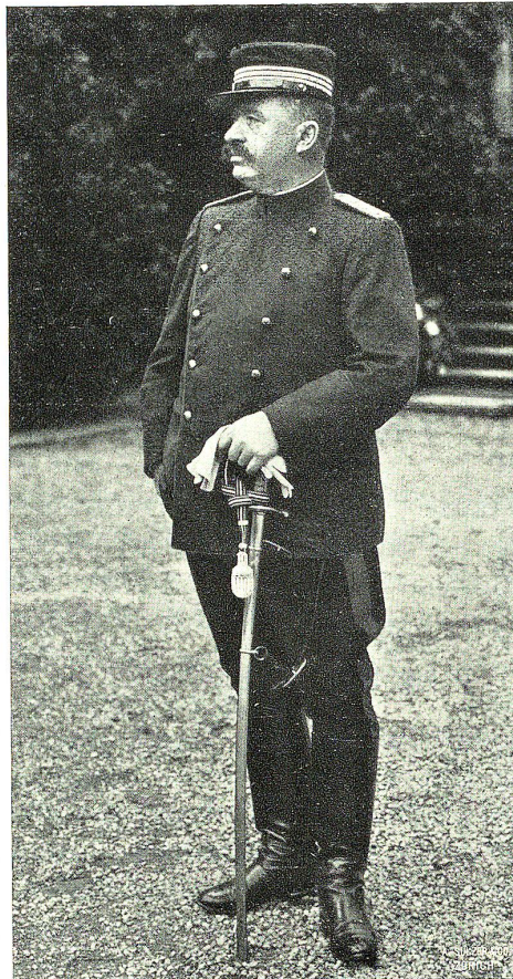
General U. Wille

weiligen Reise zu lindern, die Dürstenden zu laben, die Aermsten zu stärken. Nicht alle der Verpflegten werden die empfangenen Wohlthaten vergessen. . . . „Evviva la Svizzera“ wird es noch in manchem lombardischen oder piemontesischen Herzen leise nachhallen, und in Venetiens Alpentälern wird noch oft von den Leiden und Freuden jener Fahrt gesprochen werden.