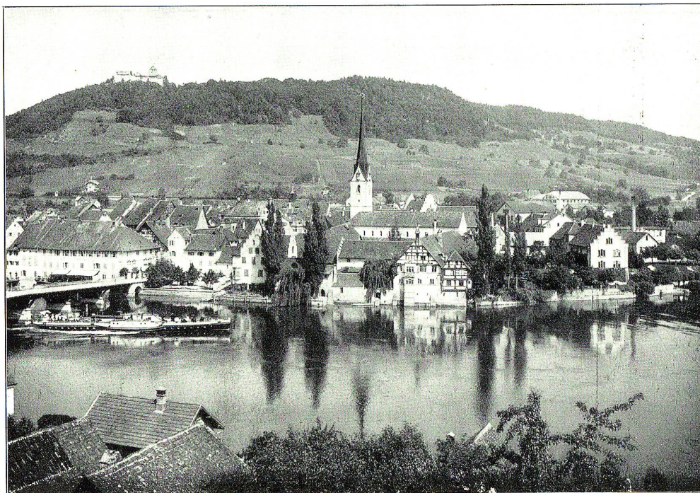
STEIN a. Rhein.

Der „Bengel“, ein Steward mit Kaffeetablett, erscheint natürlich sehr bald wieder; und Roland sieht so grimmig und zugleich so komisch verzweifelt aus, dass das blasse, junge Mädchen, das in der Nähe des