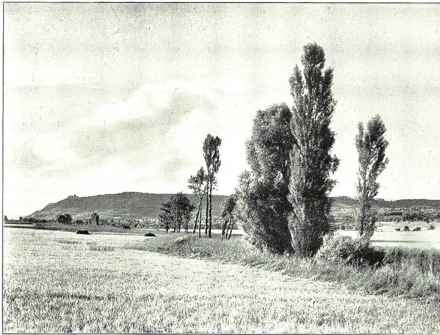
Strandbild vom Untersee.

vaterzeit im Regiment: Auf dem Marktplatz, im Kloster St. Georgen, in allen Gassen prangt das Mittelalter neben der Biedermeierzeit. Und rings um das Städtchen lacht die sonnige, friedliche, goldene Welt in die gegenwärtige Stunde hinein!