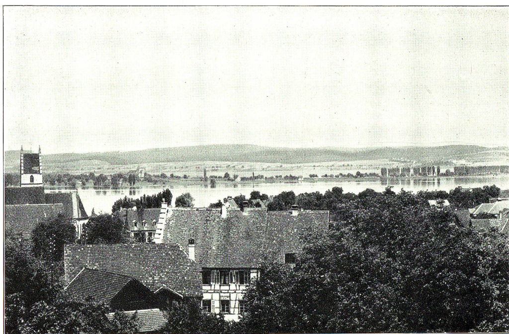
ERMATINGEN a. Untersee.

Raum finden, indes die Höhen eine ganze Reihe historisch merkwürdiger Schlösser tragen, die still ins fruchtbare, herrliche Land hinausschauen. Ein Idyll am andern entrollt sich lieblich den Augen des entzückten Beschauers, der, auf dem eilig gleitenden Rheindampfer sitzend, all die Schönheiten dieser paradiesischen Landschaft an sich vorübergleiten lässt. Jeder Dampfschiffhalt bedeutet eine Versuchung zum Aussteigen, alle Uferorte sehen so gewinnend, so hübsch und originell aus, dass man verweilen möchte, nicht weiterzieh'n und wandern. Gottlieben, Ermatingen, Mannenbach, Berlingen, Mammern, am badischen Ufer drüben Gaienhofen und Marbach dürfen füglich als landschaftliche Perlen bezeichnet werden.