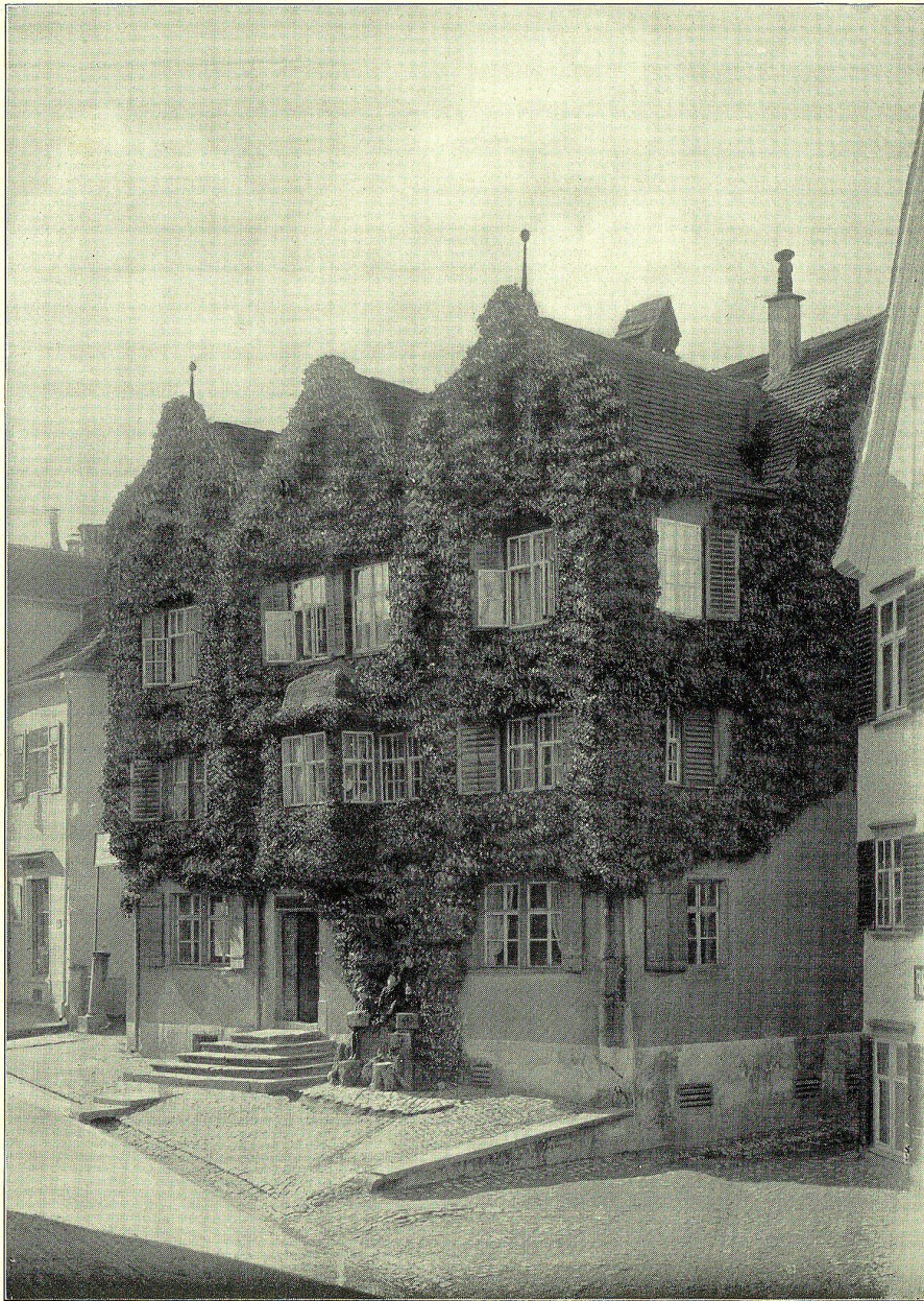
Das verchwundene Epheuhaus am Hengart, ein Rorschacher Herrensiß aus alter Zeit.

Illustrationsdruck der Buchdruckerei E. Löpf-Benz, Rorschach.