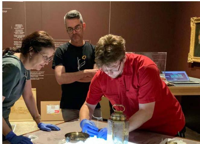
Montage de l'exposition «Un artisanat brillant. Atelier d'orfèvrerie Bossard Lucerne» au Musée national Zurich.

Les collaboratrices et collaborateurs du Centre des collections ont assuré la préparation des différentes expositions en matière de conservation et de logistique en apportant, montant et démontant les objets. Ainsi, 240 objets de la collection ont été préparés conformément aux règles de conservation avant d'être mis en place dans l'exposition «Un artisanat brillant. Atelier d'orfèvrerie Bossard Lucerne». Les mesures de restauration entreprises sur un kiosque en bois inoccupé datant du XX e siècle et ayant marqué le paysage urbain de Locarno jusqu'en 2008 ont également été achevées. Ce kiosque constitue la pièce maîtresse de l'exposition «Les univers de consommation. Le quotidien sous la loupe», qui a été inaugurée en décembre au Musée national Zurich.