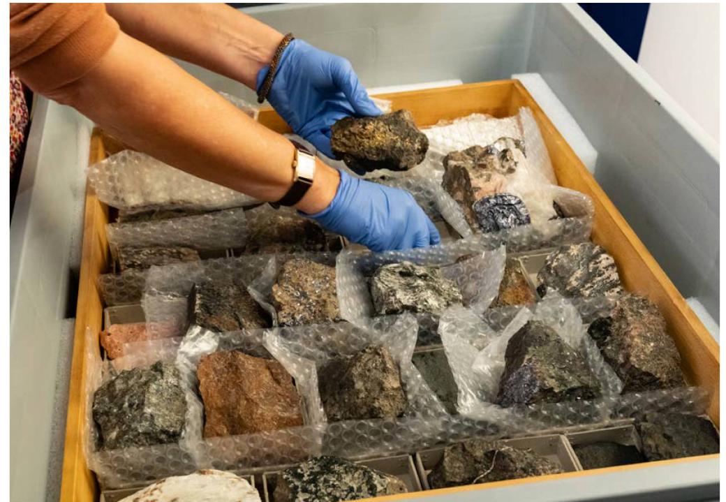
Des minerais provenant de la collection d'Arnold Heim sont préparés pour l'exposition «Colonialisme: une Suisse impliquée».

Quelque 1100 personnes ont participé à 88 visites guidées au Centre des collections. 260 étudiantes et étudiants ont pu avoir un