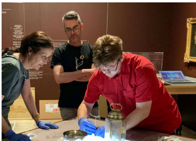
Montage de l'exposition «Un artisanat brillant. Atelier d'orfèvrerie Bossard Lucerne» au Musée national Zurich.

Les collaboratrices et collaborateurs du Centre des collections ont assuré la préparation des différentes expositions en matière de conservation et de logistique en apportant, montant et démontant les objets. Ainsi, 240 objets de la collection ont été préparés conformément aux règles de conservation avant d'être mis en place dans l'exposition «Un artisanat brillant. Atelier d'orfèvrerie Bossard Lucerne». Les mesures de restauration entreprises sur un kiosque en bois inoccupé datant du XX e siècle et ayant marqué le paysage urbain de Locarno jusqu'en 2008 ont également été achevées. Ce kiosque constitue la pièce maîtresse de l'exposition «Les univers de consommation. Le quotidien sous la loupe», qui a été inaugurée en décembre au Musée national Zurich.