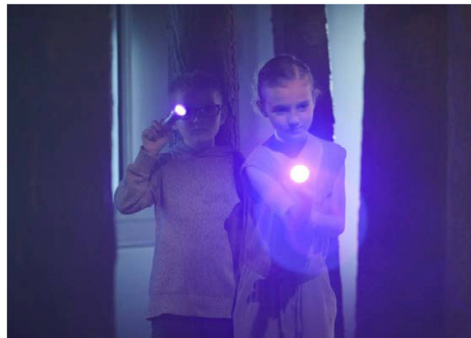
Deux enfants explorant l'exposition permanente.