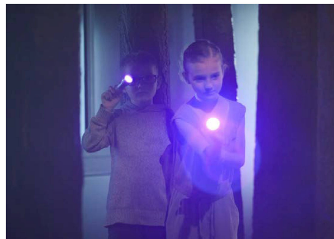
Deux enfants explorant l'exposition permanente.