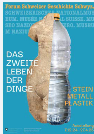
Affiches des expositions qui ont été inaugurées en 2024.