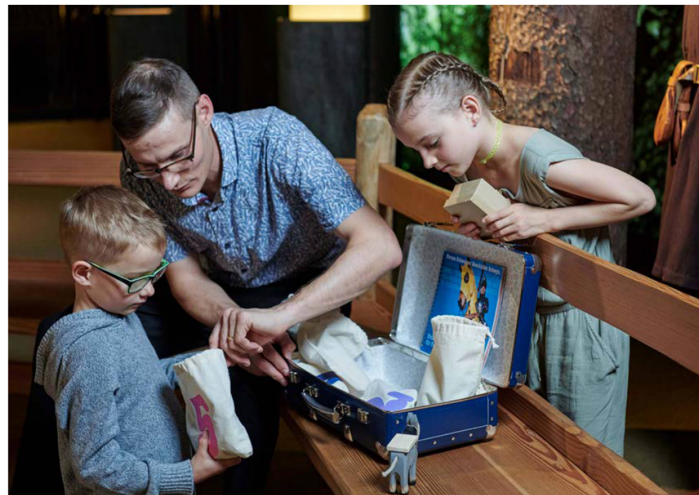
La mallette-découverte permet aux familles de redécouvrir l'exposition permanente.

L'exposition permanente «Les origines de la Suisse» a également encore attiré de nombreuses classes: 141 d'entre elles ont choisi le programme «History Run Schwyz», 100 ont opté pour une visite générale et 10 pour d'autres offres. L'intérêt de la Suisse italophone a de nouveau augmenté par rapport à l'année précédente avec 77 visites guidées en italien, dont 46 fois le programme «History Run Schwyz». L'offre pour les familles a également été étendue: la visite guidée du chevalier Arnulf est très demandée depuis qu'elle a été remaniée à l'intention des enfants et des familles. La nouvelle mallette-découverte procure aux familles un accès interactif et innovant à l'exposition permanente.