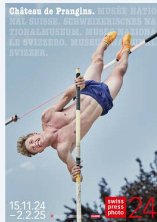
Affiches des expositions qui ont été inaugurées en 2024.