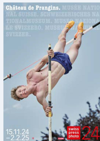
Affiches des expositions qui ont été inaugurées en 2024.