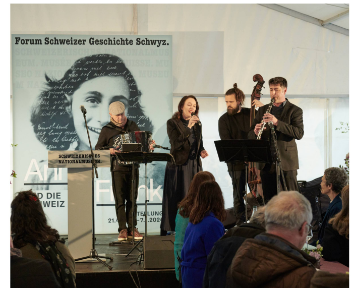
L'ensemble BENDORIM a joué à l'occasion du vernissage «Anne Frank et la Suisse».

Les grandes manifestations culturelles du Forum de l'histoire suisse Schwytz se sont achevées avec la Nuit du shopping dans une mer de lumière (Einkaufsnacht im Lichtermeer) le 3 décembre. Malgré une pluie battante, de nombreuses personnes sont venues au Forum où les attendaient nos médiatrices et médiateurs culturels avec quelques visites guidées dans un format court.