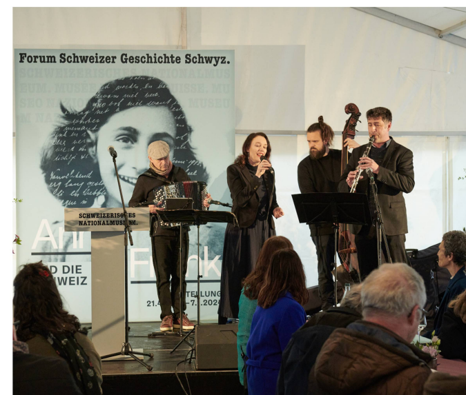
L'ensemble BENDORIM a joué à l'occasion du vernissage «Anne Frank et la Suisse».

Les grandes manifestations culturelles du Forum de l'histoire suisse Schwytz se sont achevées avec la Nuit du shopping dans une mer de lumière (Einkaufsnacht im Lichtermeer) le 3 décembre. Malgré une pluie battante, de nombreuses personnes sont venues au Forum où les attendaient nos médiatrices et médiateurs culturels avec quelques visites guidées dans un format court.