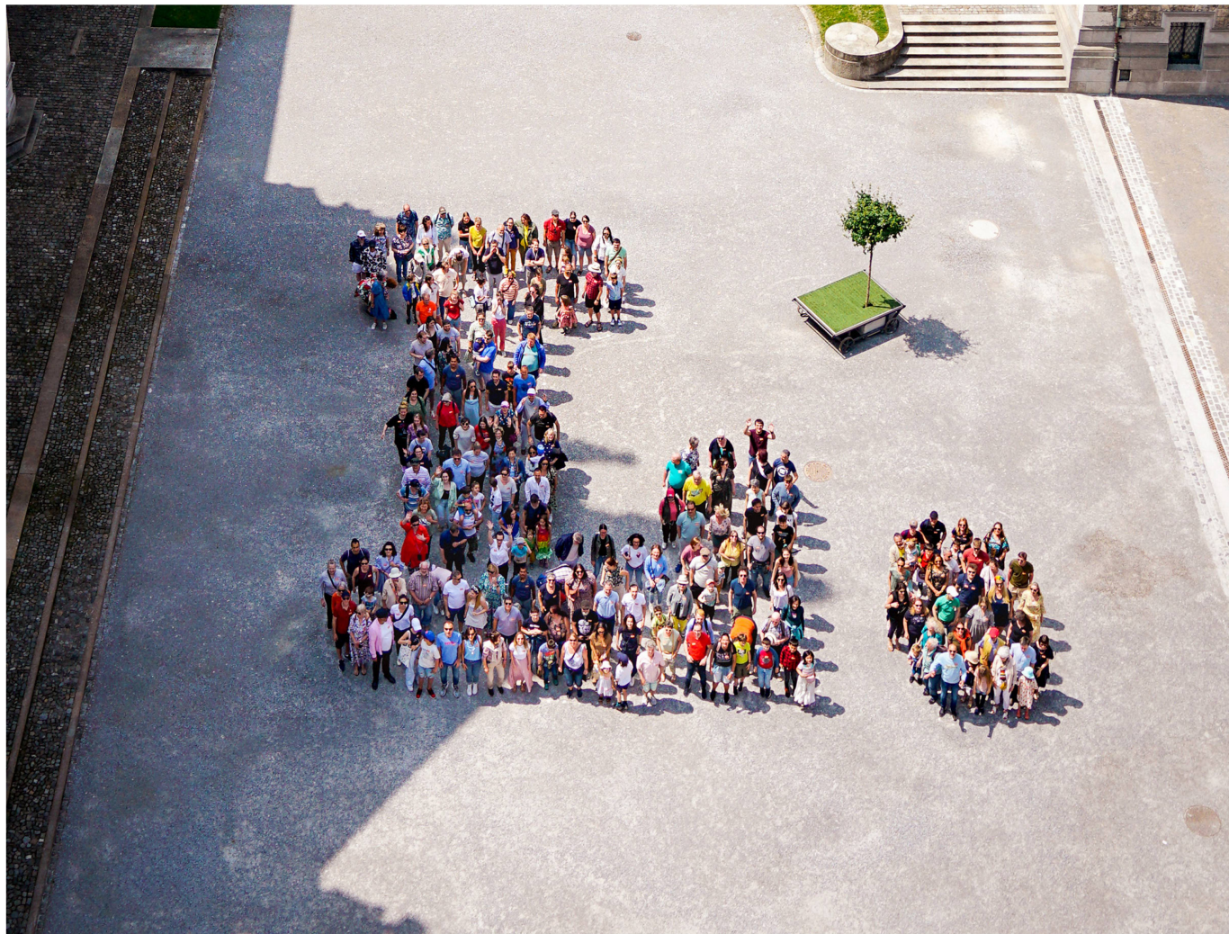
Une activité participative spéciale pour petits et grands a donné l'occasion de faire partie du jubilé du Musée national Zurich.