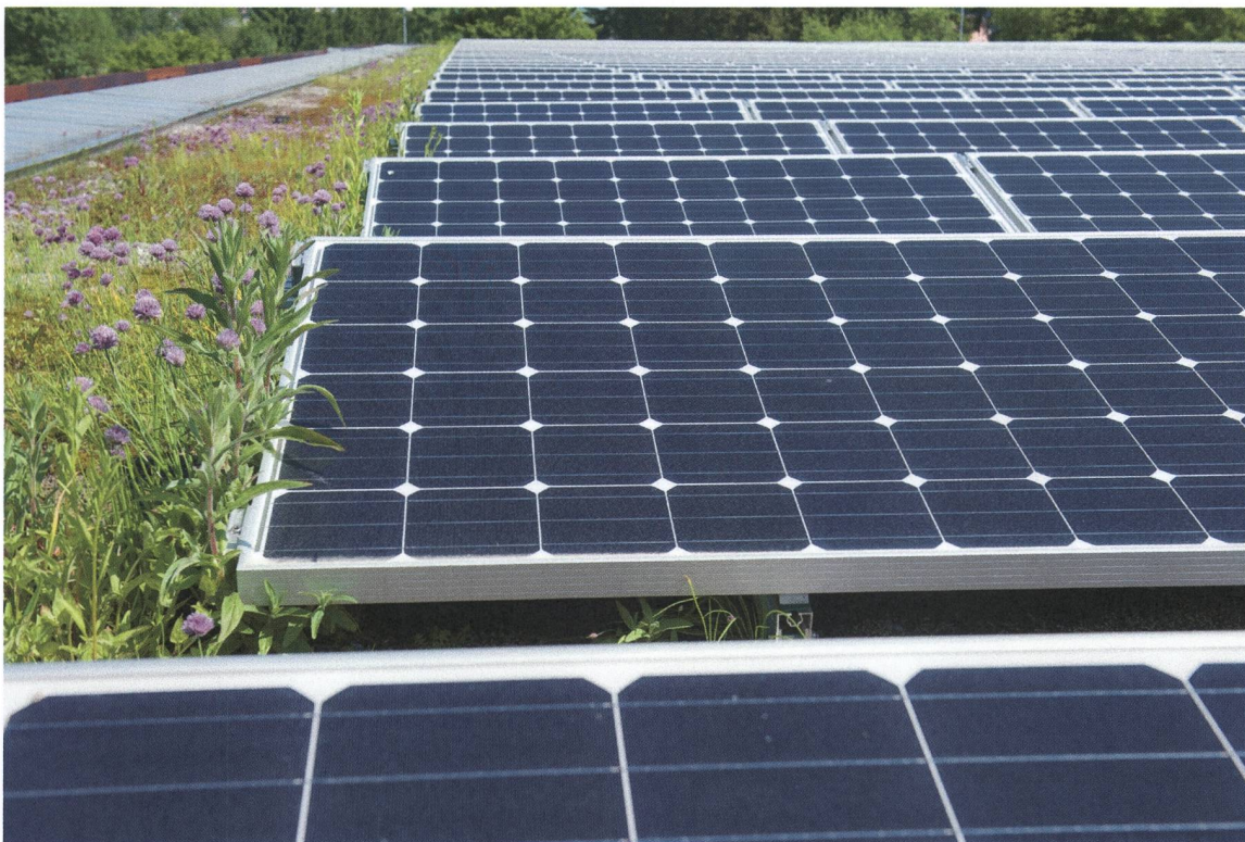
L'installation photovoltaïque sur le toit du Centre des collections d'Affoltern am Albis.