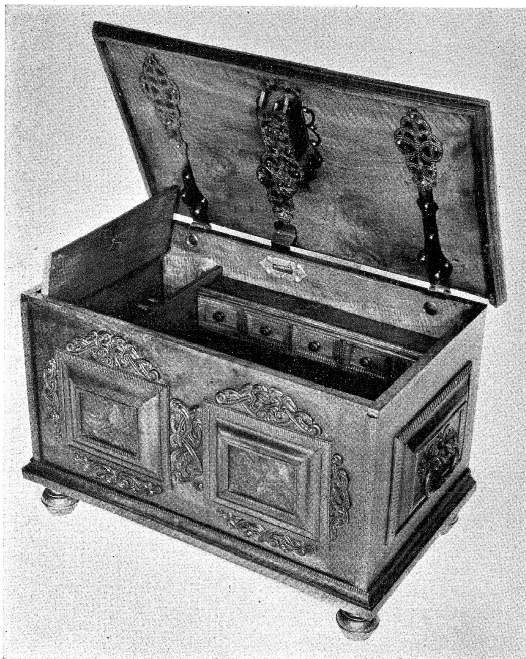
Fig. 4. Bahut en bois dur, de Winterthour. Fin du 17 e siècle.

Les archives des monuments historiques ont de nouveau participé cette année aux expositions organisées par la Société suisse pour la conservation des châteaux et des ruines.