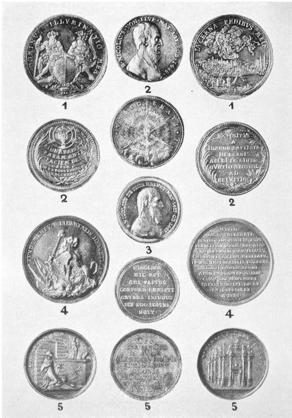
Medaillen von Johann Karl Hedlinger (1691 — 1771).