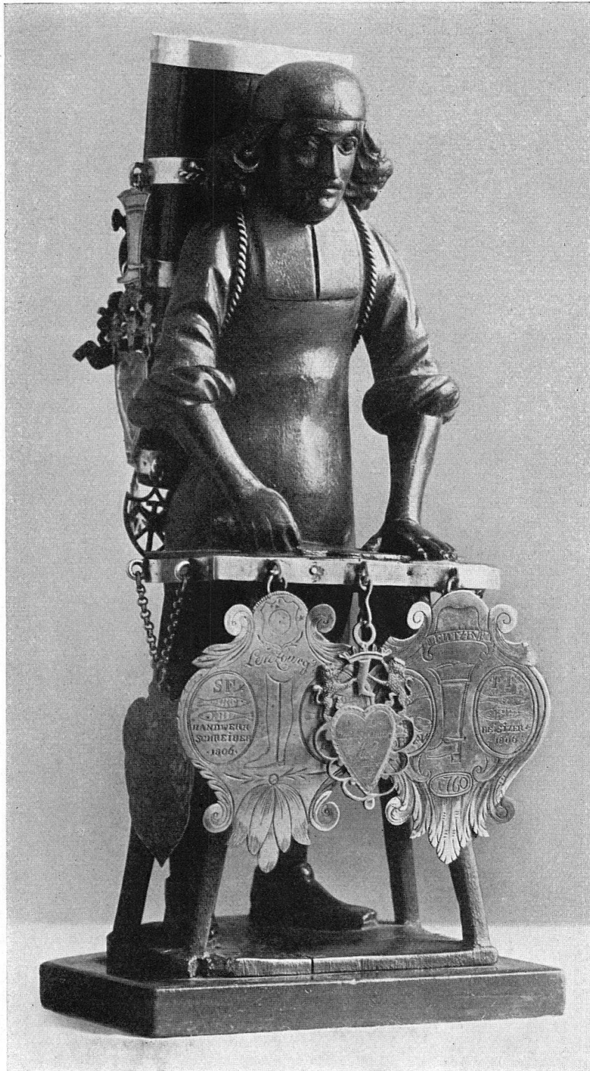
Zunftstück, darstellend einen Schuhmacher. Aus Lenzburg. 18. Jahrh.