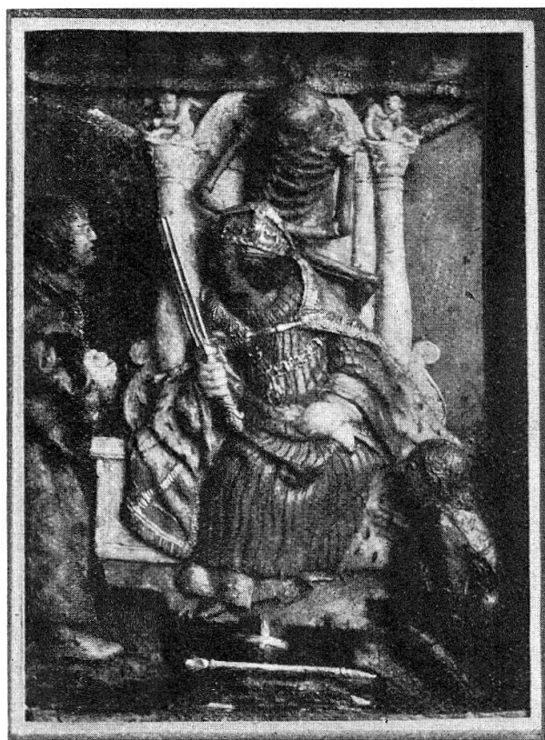
Fig. 1. Empereur d'une danse des morts d'après H. Holbein le jeune, cire peinte, XVIe s.

9) Objets d'art et gravures: Figure en bois représentant un cordonnier debout, derrière sa table, portant une hotte à laquelle pendent des plaquettes d'argent et des médailles se rapportant aux cordonniers de Lenzburg et datées de 1753 à 1838 (pl. VII). — 3 figures en cire représentant l'empereur, l'impératrice et le pape, provenant d'une danse des morts d'après des gravures sur bois de Hans Holbein le jeune, XVIe s. (fig. 1 et 2). — Peinture sur toile représentant l'attaque des Schwytzois contre la fortification des Zuricois près de Hütten, avec l'inscription: „Schweitzer Krieg auff Hütten a. 22ten Heuw. nat. Ao. 1712 Morgens zwischen 3 und 4 uhren“, et les armes de sous-officiers zuricois.