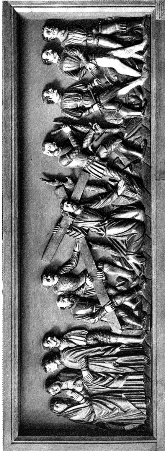
Bemaltes Holzrelief, darstellend die Kreuztragung. Kt. Wallis. Anfang 16. Jahrhundert.