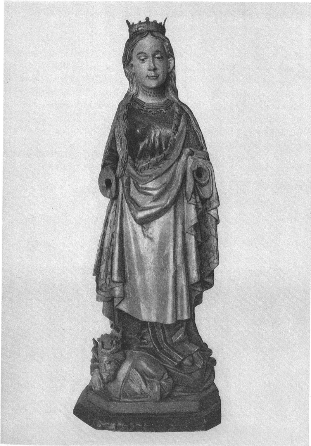
St. Katharina von Alexandrien. Kt. Wallis. 15. Jahrhundert.