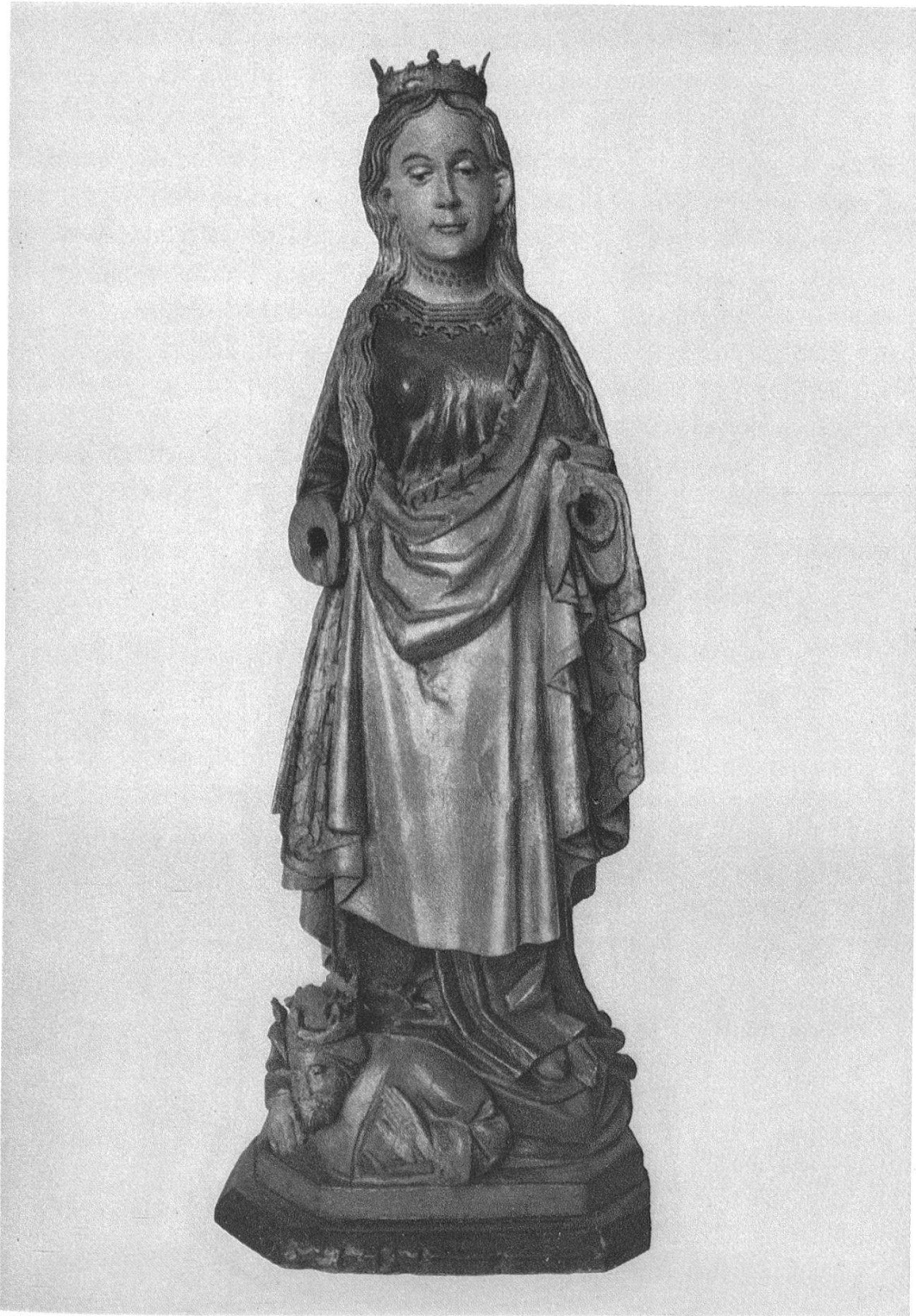
St. Katharina von Alexandrien. Kt. Wallis. 15. Jahrhundert.