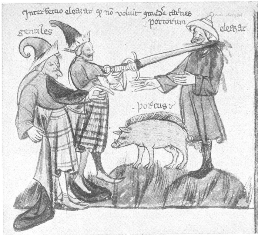
Abb. 2. Eleazar soll gezwungen werden, Schweinefleisch zu essen.

Scheiterhaufen stand, fragte er ungestüm, wo denn das Feuer sei. Da liess ihn der Kaiser wieder vor sich bringen und befahl, man solle ihm die Zunge ausreissen. Romanus liess es ruhig geschehen und sich ins Gefängnis abführen. Im zwanzigsten Jahre der Regierung Diokletians soll er erwürgt worden sein, während man Andere frei liess. Unser Relief stellt dar, wie der Kaiser den Befehl zum Ausschneiden der Zunge erteilt. Ein Engel bringt dem Heiligen dafür die Märtyrerkrone und oben im Winkel wird sogar der hl. Geist als Taube sichtbar. Der Kaiser trägt genau die gleiche Krone mit dem aus ihr herauswachsenden Zipfel, wie der König Balthasar. Mit solchem Kopfputze pflegte man im 14. und 15. Jahrhundert die Herrscher im Morgenlande und die heidnischen überhaupt auszuzeichnen. Wir führen zum Vergleiche ein Bild aus den Kommentaren des Nikolaus von Mira zu einigen Büchern des Alten Testaments nach dem Manuskripte von 1393 in der Universitätsbibliothek in Basel (Mskr. A. N. II, 5, an 1 ), darstellend Eleazar, den