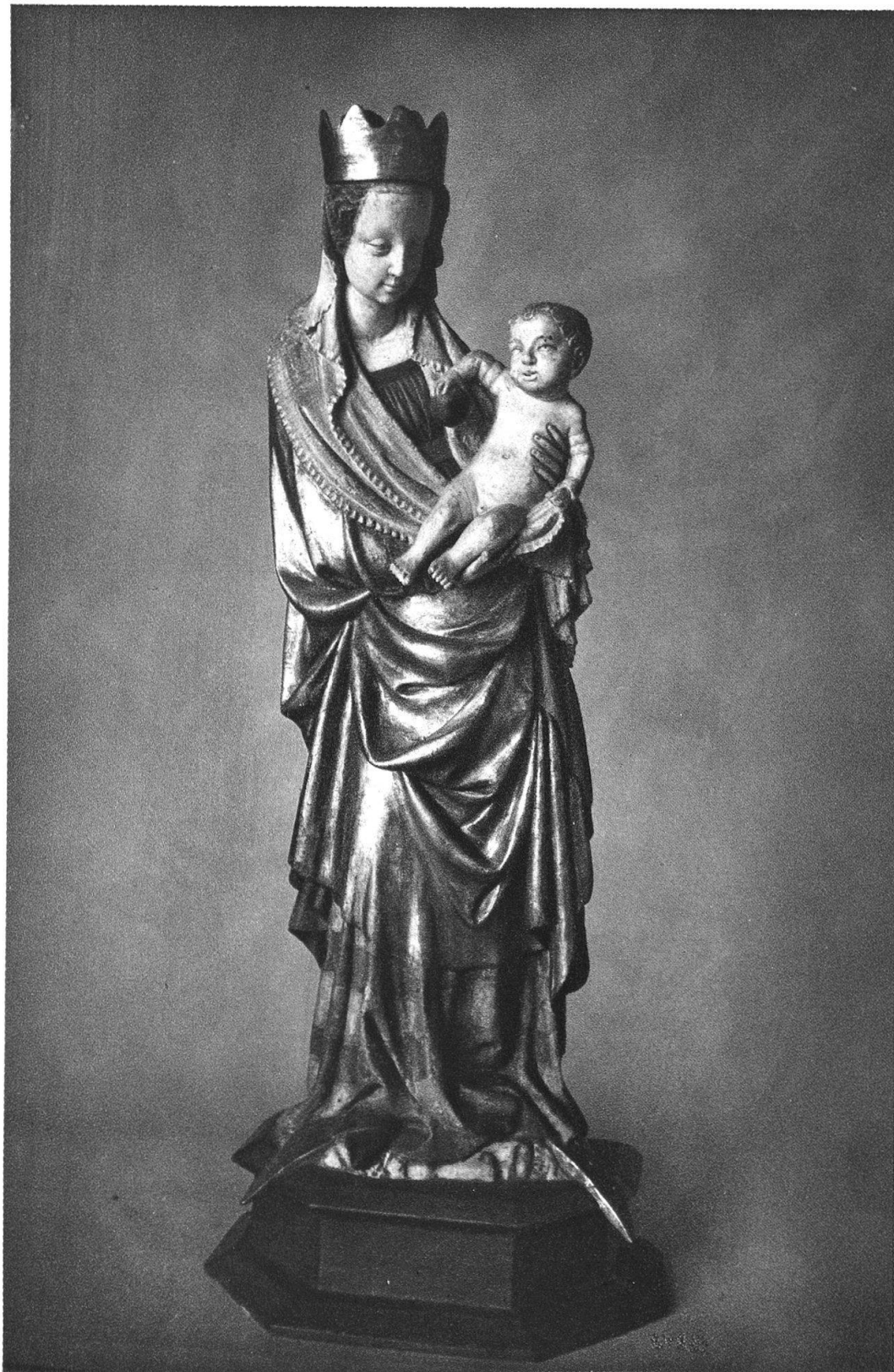
Madonna aus dem Baldachin-Altar von Leiggeren (Kt. Wallis).