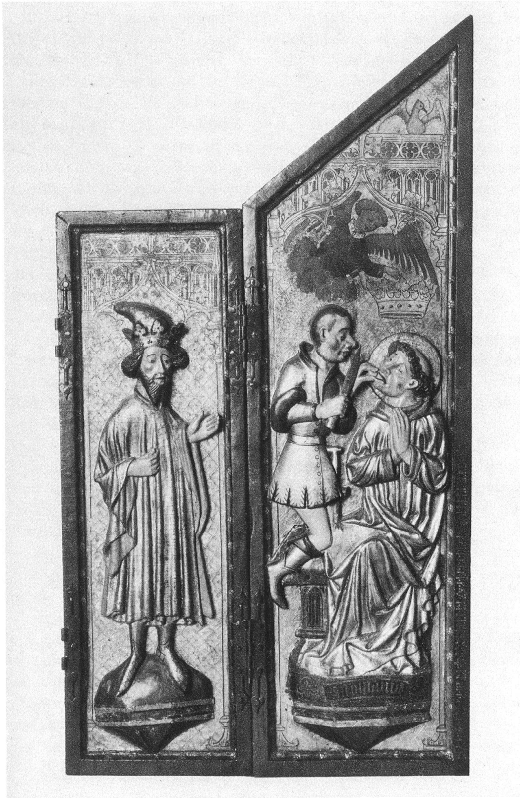
Altar aus Leiggenen. Rechter Flügel mit dem Martyrium des hl. Romanus.