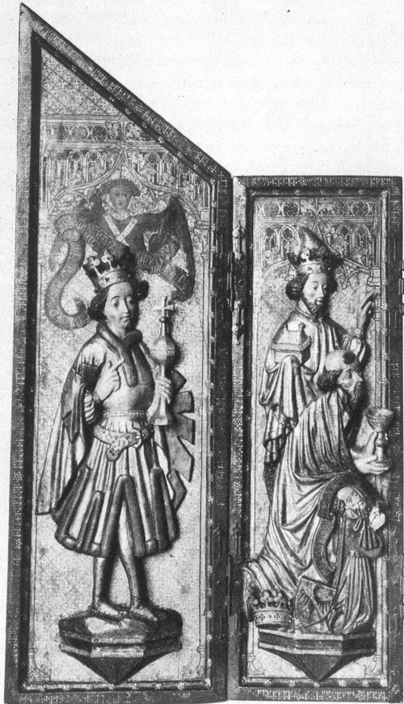
Altar aus Leiggenen. Linker Flügel mit Anbetung der hl. drei Könige und dem Stifter.