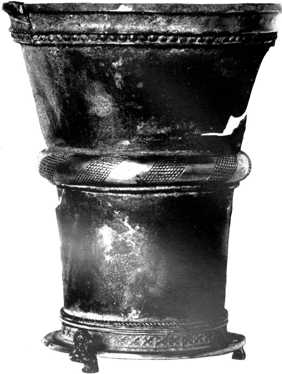
Abb. 14. Silberner Becher, vermutlich aus dem Besitze Herzog Karls des Kühnen. Burgundische Arbeit. 15. Jahrhundert.