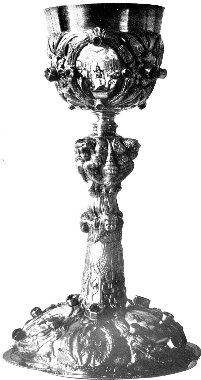
Abb. 17. Silbervergoldeter Speisekelch von Heinrich Dumeisen. 17. Jahrhundert.