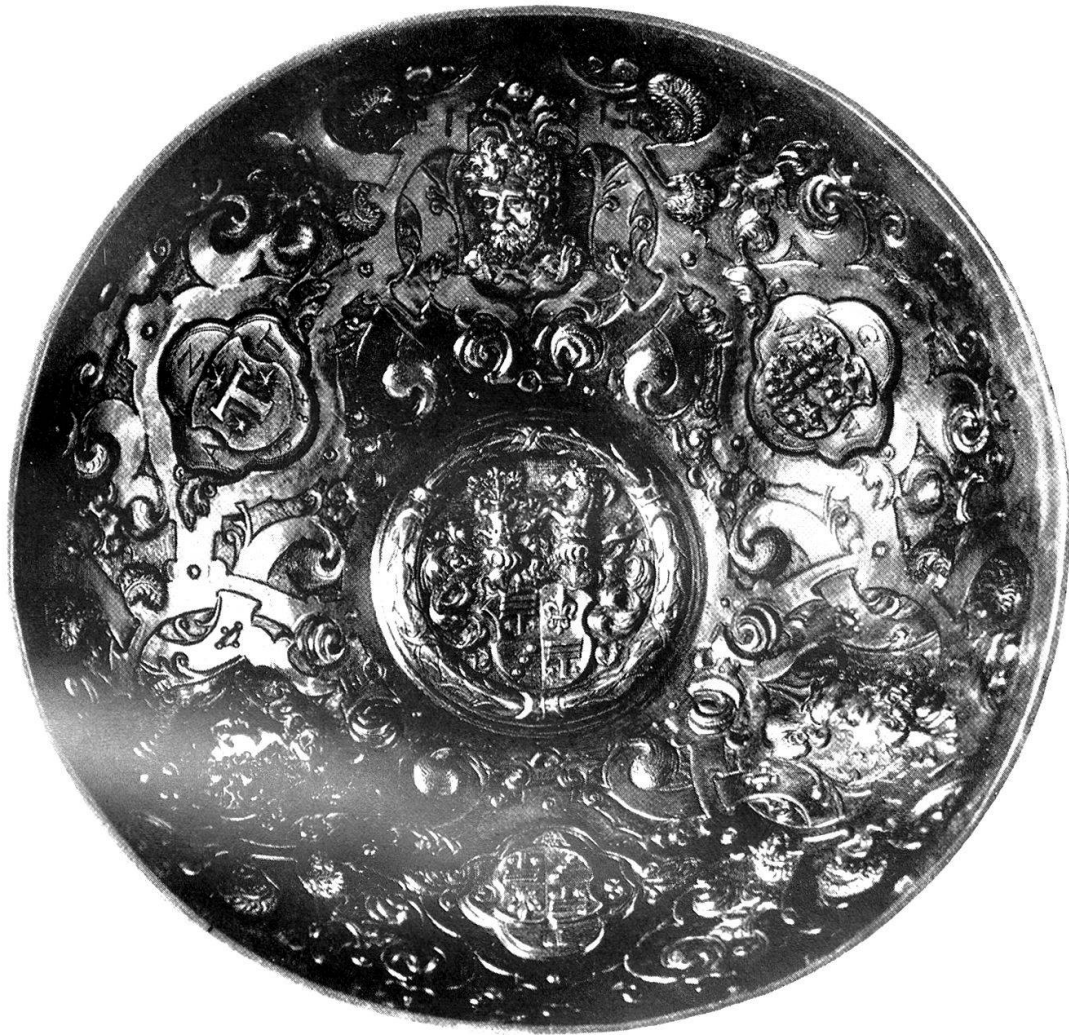
Abb. 16. Silbervergoldete Trinkschale aus dem Wallis. (Innenansicht.)