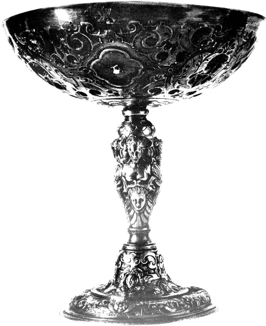
Abb. 15. Silbervergoldete Trinkschale aus dem Wallis. 16. Jahrhundert.