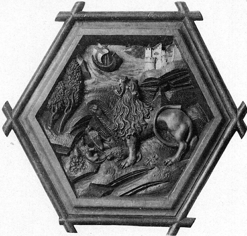
Médallions en bois sculpté et peint provenant d'un plafond du couvent de St. Georges à Stein sur le Rhin, Commencement du 16 m e siècle. VI.