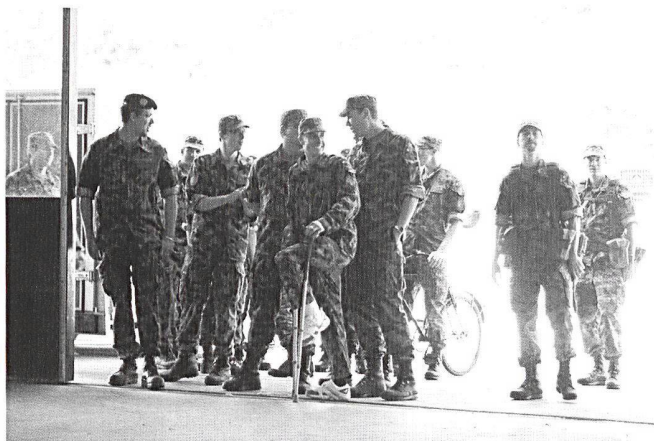
Effervescence à Moudon pour l'organisation d'une journée portes ouvertes.

La troupe a bien joué le jeu, chaque poste a été présenté avec plaisir et interactivité. Montage, démontage des armes, matériel de cuisine de campagne, radio SE-430, SE-235 ou encore RITM avec possibilité d'essayer les appareils. L'intérêt des visiteurs était bien présent !