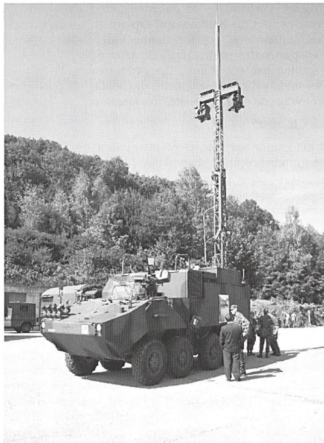
Lors d'engagement mobiles, ou pour renforcer les concentrations fixes, le RAP-Panzer est engagé.

Démonstration des équipements de la salle de conduite (TOC) d'une Grande Unité.