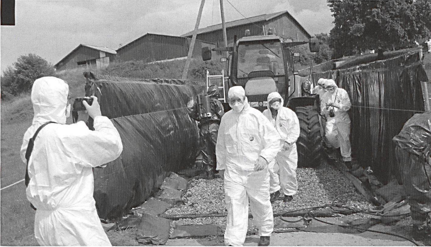
Autoluve monté par une formation d'intervention en cas de catastrophe.