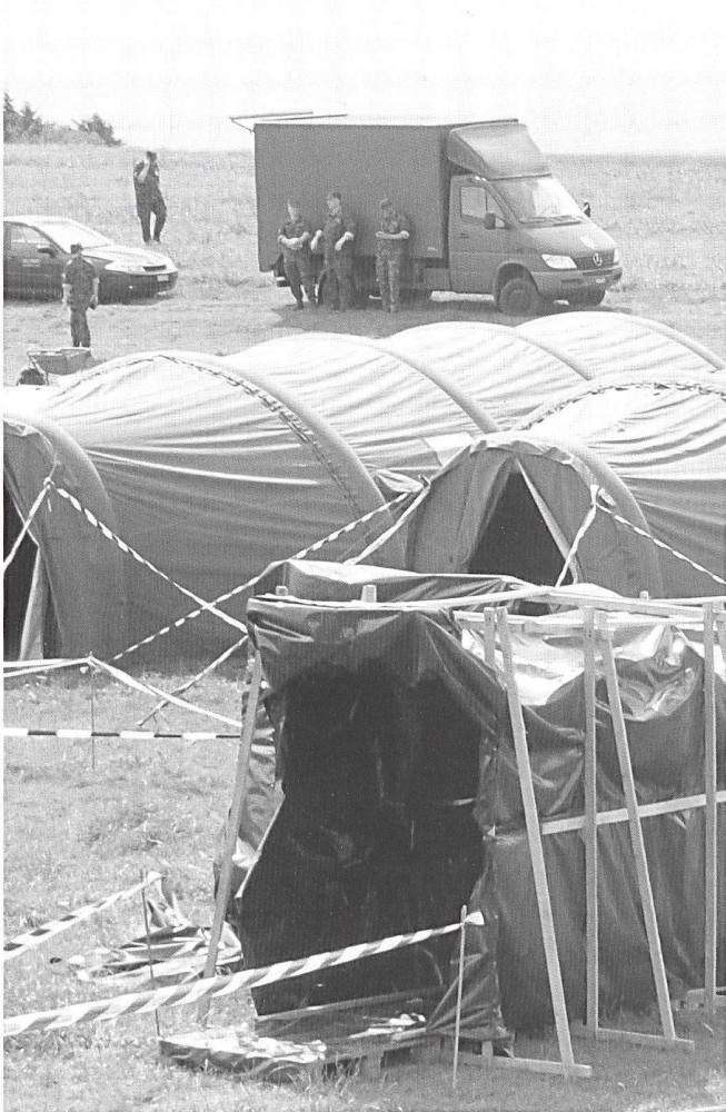
3 Sas d'entrée/sortie de la zone contaminée avec, à l'avant, un passage de décontamination avec douche.