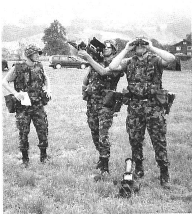
Une équipe Stinger.

des services devraient grandement contribuer à ce but. Si l'instruction sur simulateur reste un outil de travail économique et performant, il faut pourtant effectuer régulière-