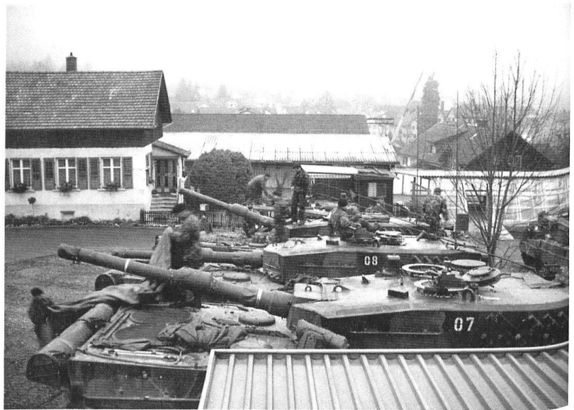
La cp chars II/17 prête à quitter son secteur d'attente de Balterswil.

Intensif – voilà qui évoque l'esprit du cours de répétition 2002! Le bataillon a été engagé simultanément sur les places de tir de Hinterrhein et de Wichlen. Distantes d'à peine 30 km à vol d'Alouette, les deux places de tir sont tout de même à plus de 150 km de route l'une de l'autre! La vue d'ensemble s'est avérée complexe, au regard de conditions météorologiques catastrophiques, de changements d'emplacements rendus nécessaires par des coulées