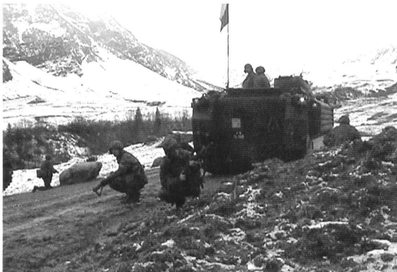
Des grenadiers de chars débarqués.

Le «déséquilibre» 3: 1 entre chars et grenadiers de chars ne pourra se régler que par la mise en service d'une seconde tranche de CV-9030 . Fidèles à la devise «Moins mais mieux», les grenadiers disposeront désormais d'une panoplie d'armes moins étendue. Il est vrai qu'il est difficile d'imaginer qu'un jeune chef de section engage simultanément et de façon optimale des fusils, des fusils à lunette, des lance-grenades, des canons 20 mm, des Panzerfaust , des Dragon , des mines antichars, des tubes et des moyens explosifs. L'introduc-