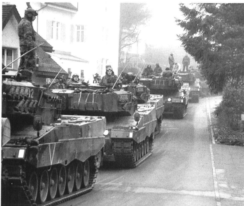
Déplacement et prise de secteur d'attente pour la II/17.

Nous avons bénéficié d'effectifs suffisants, grâce à environ 30% «d'invités» dont cer-