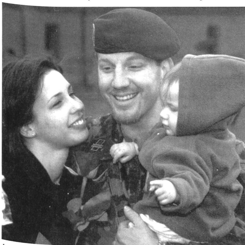
La femme et la famille jouent un rôle dans une carrière militaire...

C'est dire à quel point les qualités aujourd'hui requises