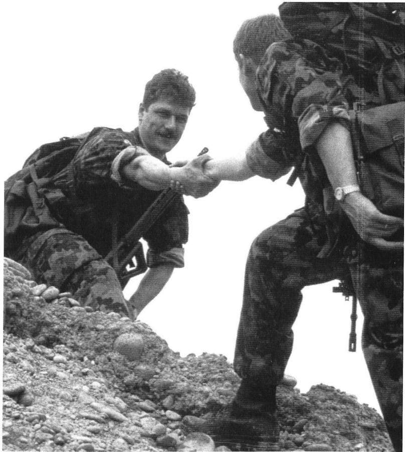
Camaraderie et solidarité.

Que notre armée démissionne est une évidence: il suffit pour s'en convaincre de considérer la spectaculaire augmentation des licenciements dans les écoles de recrues. Mais elle peine également à séduire et à susciter l'avancement, comme le montre la diminution de moitié du nombre d'aspirants officiers en dix ans. Il manque clairement à l'institution militaire un outil de recherche et d'évaluation sociologique qui lui fournirait les tendances en termes de personnalités, d'aptitudes et d'aspirations au sein des futurs conscrits, car les éléments mentionnés plus haut