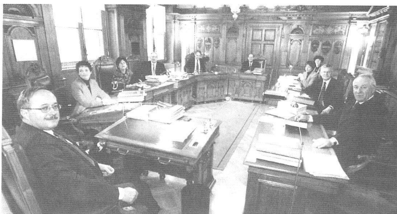
Samuel Schmid est-il entendu par ses collègues, quand il parle de défense ?

En résumé, la Suisse a fait des efforts intellectuels méritoires pour s'adapter aux nouveaux défis stratégiques, mais elle n'a pas veillé à conserver un degré d'entraînement suffisant de ses forces terrestres et à assurer un financement adéquat de la modernisation de ses armements. Il a déjà été question des dégâts causés dans le domaine de l'instruction, partant de la motivation, ce qui est im-